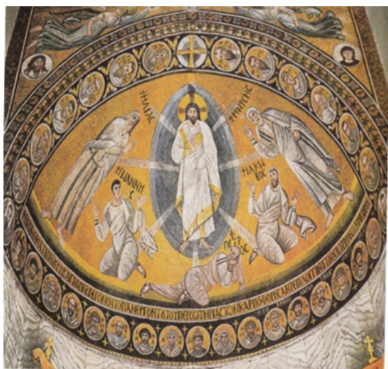
تصویر ۱۵: تبدیل مسیح، نقش موزاییک شاه‌نشین کلیسا، دیر سنت کاترین، کوه سینا، مصر، (هارت، ۱۳۸۲: ۳۲۹).