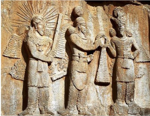
تصویر ۱۰: میترا خدای خورشید با شعاع نوری برگرد سرش (نقش برجسته تاق بستان).

جای گرفته‌است - میترا از ایزدان باستانی هند و ایرانی پیش از روزگار زرتشت است.» (بلخاری، ۱۳۸۸: ۷۶). و البته این وجه تابندگی و فروغ درخشان آن هنرمندان و صنعتگران را واداشته تا در تصویر شاهان و بزرگان با ایجاد هاله تابان مقامی فرا انسانی به آن‌ها بدهند.