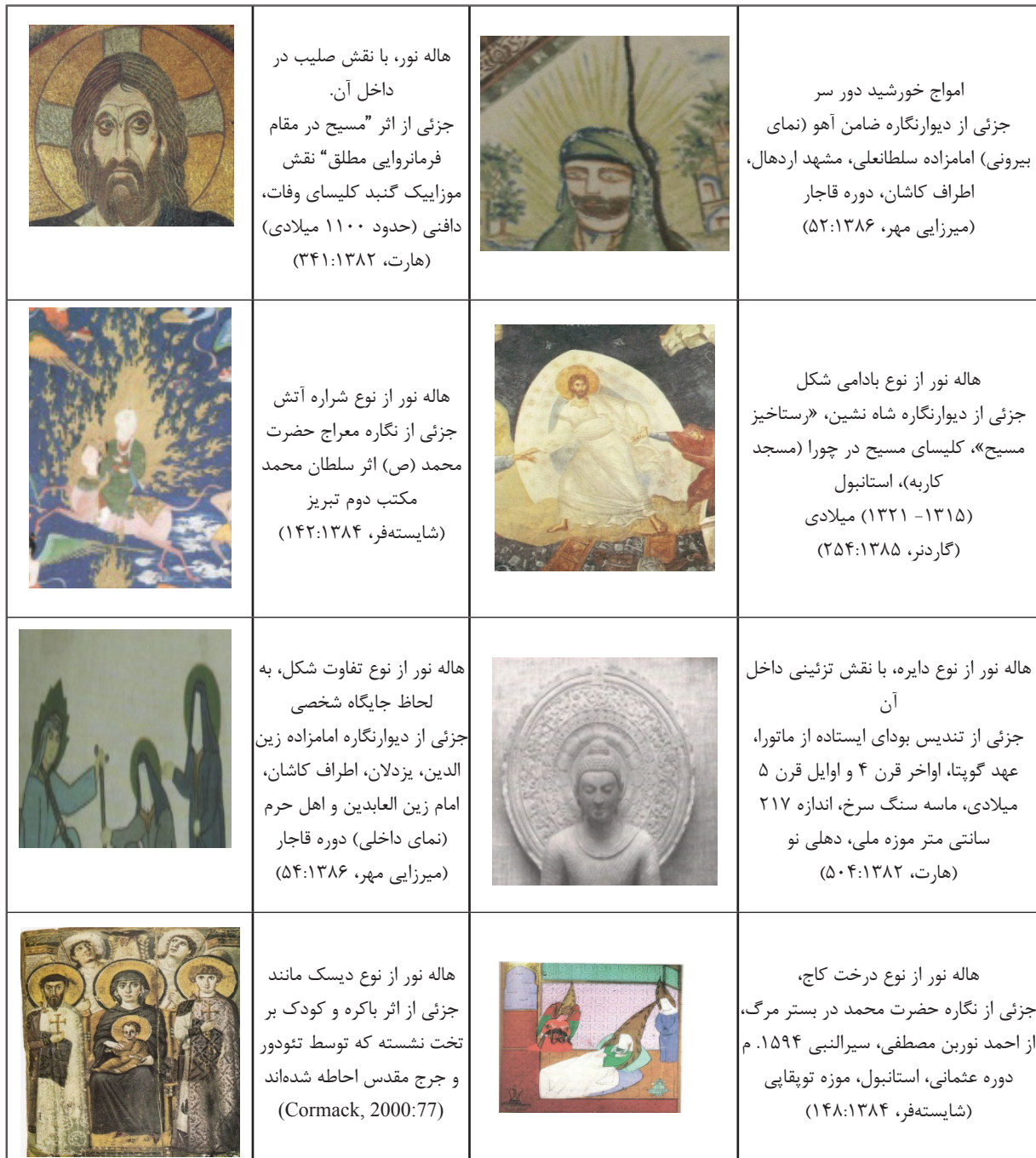
جدول ۱: اشکال متفاوت هاله نور در ادوار مختلف.