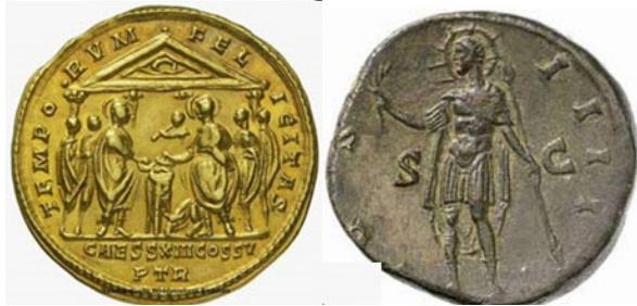
تصویر ۶: نپتون (گداخت، ۲۰۰۴: ۴۱). تصویر ۷: سکه‌های روم باستان