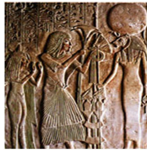
تصویر ۳: خدای سخت (کمپ، ۲۰۱۷: ۱۴).

در فرهنگ یونانی هم نمونه‌هایی بود. هرودوت مورخ یونانی، که در قرن پنجم قبل از میلاد از رود نیل بازدید کرد، به این نتیجه رسید که مردم مصر بیش از دیگر ملل به سمت ادیان و مذاهب قدم برداشته‌اند. شاید این مسئله دلیلی بر فراوانی هاله در هنر مصریان باشد: مصریان بیش از یونانیان تمایل به موارد الهی و با شکوه داشتند. آیا یونانی‌ها و رومیان استفاده از هاله را هم زمان شروع کردند و یا از فرهنگ مصر یاد گرفتند؟ پاسخ قطعی نمی‌توان داد. در تصویر زیر هلیوس خدای یونانی خورشید و هاله در اطراف سر او کشیده شده است. در تصویر دوم، هلیوس با خواهر خود ائوس، الهه سپیده دم و پسرش فورئوس، خدای ستاره صبح به تصویر کشیده شده‌اند. اکثر خدایان یونانی با هاله به تصویر کشیده نشده‌اند. به نظر می‌رسد که فقط هلیوس و فرزندانش جزو این دسته هستند (روبرتسون، ۱۹۸۱: ۹۷ و ۴ و ۵).