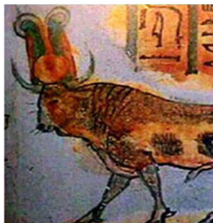
تصویر ۱: گاو آپیس (هارتویگ، ۲۰۱۴: ۹۲).

هنوز با یقین نمی‌توان گفت که منشأ اصلی هاله نور، مربوط به چه تمدنی است. چرا که مورخین تقریباً نظریات متفاوتی دارند. به نظر می‌رسد استفاده از هاله همراه با عبادت خورشید مصری و حیوانات وجود داشته‌است. آیین دینی پرستش گاو به حدود ۳۰۰۰ سال پیش از میلاد بر می‌گردد. گاو آپیس ۱ اولین نشانه‌ها از نماد هاله مانند را نشان می‌دهد. هاله‌های مصریان معمولاً به شکل یک کره بزرگ آفتاب رنگی نشان داده شده (تصویر ۱) که متفاوت از تصور مدرن و امروزی هاله است: به صورت یک دایره توخالی معلق در بالای سر یک فرشته (هارتویگ، ۲۰۱۴: ۹۲). پیدا کردن نمونه‌هایی از آن سخت نیست. تصویر سمت چپ خدای مصر «را» است. تصور می‌شود «را» خود ساخته و پدر همه خدایان باشد که با خورشید در ارتباط بود (تصویر ۲). در وسط، طرح سخمت با سر شیر است. او خدای فرستاده شده برای مجازات بشری است که احترام به خدایان را نادیده گرفته‌است. هاله راهی برای افتراق خدایان از موارد فانی عادی در هنر بود. نبود هاله بالای دو نفر ایستاده در مقابل سخمت شاهی بر این ادعاست (تصویر ۳) (کمپ، ۲۰۱۷: ۱۰).