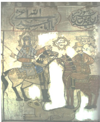
تصویر ۱۳: مدد خواستن سلطان قیس از امام حسین، دیوارنگاره‌ای از بقعه آقا سیدابراهیم باباخان دره، (میرزائی مهر، ۱۳۸۶: ۸۳).