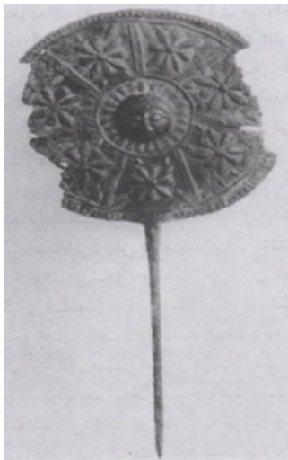
تصویر ۱۱: سنجاق سر صفحه‌ای باکله زنانه موزه هنری متروپولیتن (اتینگهاوزن، ۱۳۷۹: ۴۶).