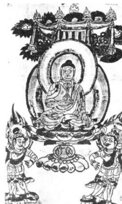
تصویر ۸: بودای چینی، کتابخانه ملی پاریس

همین‌طور گفته شده‌است که «هاله تقدس با شعله‌های متصاعد از بدن انسان، بر روی سکه‌ها و تندیس‌های شمال‌غربی هندوستان در حدود سده‌های دوم تا سوم میلادی دیده شده‌است. هاله و شعله‌های متصاعد از بدن به شکل‌های مختلف به‌صورت یکی از جنبه‌های مختلف بودا (بودیساتوا) درآمد» (هال، ۱۳۸۰: ۲۲۱). «هاله تقدس در ایران بر گرد سر میترا مشاهده شد که مظهر نور خورشید است و مربوط به ۳۴ تا ۶۹ پیش از میلاد در نمرود داغ می‌باشد» (گیرشمن، ۱۳۷۰: ۶۷). اما ثروت عکاشه در کتاب نگارگری/اسلامی دلیل وجود هاله نور در نگارگری را در هنر چین می‌داند. او می‌نویسد که «نگارگران ایرانی و پیروان هندی آن‌ها، این نقش‌مایه‌های هنری را نخست به‌طور مستقیم از سرزمین چین و یا از طریق نواحی هم‌مرز با ایران اقتباس کردند و سپس به‌صورت ویژگی‌هایی در آمد که مشخص‌کننده هنر نگارگری ایرانی گردید. یکی از این نقش‌مایه‌ها (هاله نورانی) است که ایرانیان از تصاویر بودا در چین و آسیای میانه اقتباس کردند- مانند تصویر بودای چینی، از سده نهم میلادی، که بر تخت نشسته و با دست راستش آذرخش (واگرا) را که منشأ شعله یا هاله نورانی در شمایل نگاری است، گرفته و در زیر تخت او دو نگهبان آئین بودایی (واگراپانی) با دو هاله از نور بر فراز سرشان دیده می‌شود (تصویر ۸).