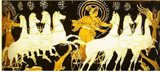
تصویر ۵: هلیوس، ائوس، فورئوس (روبرتسون، ۱۹۸۱: ۹۷).

در امپراتوری روم، برخلاف یونانیان، نماد هاله نور به صورت رسمی تعیین شد. تصویر نپتون، خدای دریا (تصویر ۶) (گداخت، ۲۰۰۴: ۱۴) و رومولوس، بنیانگذار اسطوره‌ای رم همراه با هاله نور. هاله رومولوس، قرمز و به شکل ستاره است و در مقابل پس زمینه تاریک به سختی قابل دیدن است. با پیروزی آنتونیوس پیوس در حدود سال ۱۰۰ میلادی، امپراتوری روم شروع به استفاده از هاله در سکه‌ها نمود. زمانی که سکه با هاله آراسته می‌شد، سکه نیمبیت خوانده می‌شد. تصاویر زیر نمایانگر چند امپراطور روم باستان است (سیلس، ۲۰۰۷). (تصویر ۷)