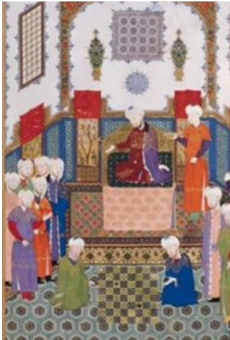
تصویر ۱۲: شاهنامه بایسنقری بازی شطرنج بوذرجمهر و سفیر هند

کوچک بودن نور منتشره، حکایت از مقام معنوی مقدسین حاضر در یک تصویر را دارد.» (شایسته‌فر، ۱۳۸۴: ۴۵). به‌طور نمونه می‌توان به تصویری از همین کتاب با عنوان نماز جماعت در اسلام اشاره نمود که در آن پیامبر اسلام به‌عنوان امام جماعت به همراه دو یار وفادارش یعنی حضرت خدیجه (س) و حضرت علی (ع) برای نماز ایستاده‌اند. نگارگر این تصویر سعی کرده تا با اندازه هاله یا با قراردادن یا ندادن هاله به افراد تصویر، جایگاه هر کدام را به مخاطبش تعریف نماید. در این نگاره «هاله تمام قد برای پیامبر و هاله‌ای کوچک و محدود به دور سر، برای حضرت خدیجه در نظر گرفته‌شده و برای حضرت امیر که نوجوان بوده هاله‌ای تعبیه نشده‌است» (همان: ۴۵).