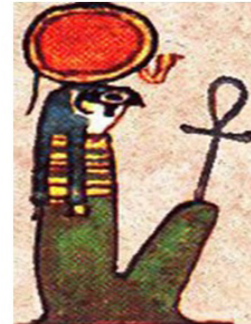
تصویر ۲: Ra (کمپ، ۲۰۱۷: ۱۴).