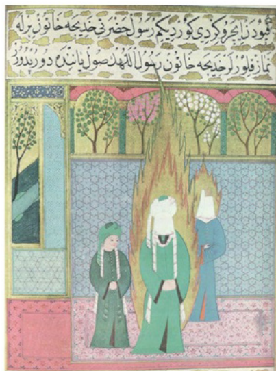
تصویر ۱۴: نماز سرآغاز اسلامی از احمدنور بن مصطفی. (شایسته فر، ۱۳۸۴: ۱۴۵).