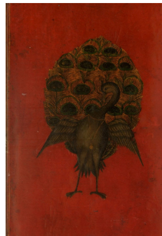
تصویر ۲: داخل جلد نسخه خطی با نقش طاووس (زبده المنتخبین)