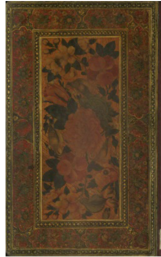
تصویر ۱: جلد نسخه خطی با نقاشی گل و مرغ (زبده المنتخبین)

رونق بسیاری داشت و بیشتر جلدهای این دوران با تکنیک نقاشی لاکه یا روغنی هستند (تصویر شماره ۱ و ۲).