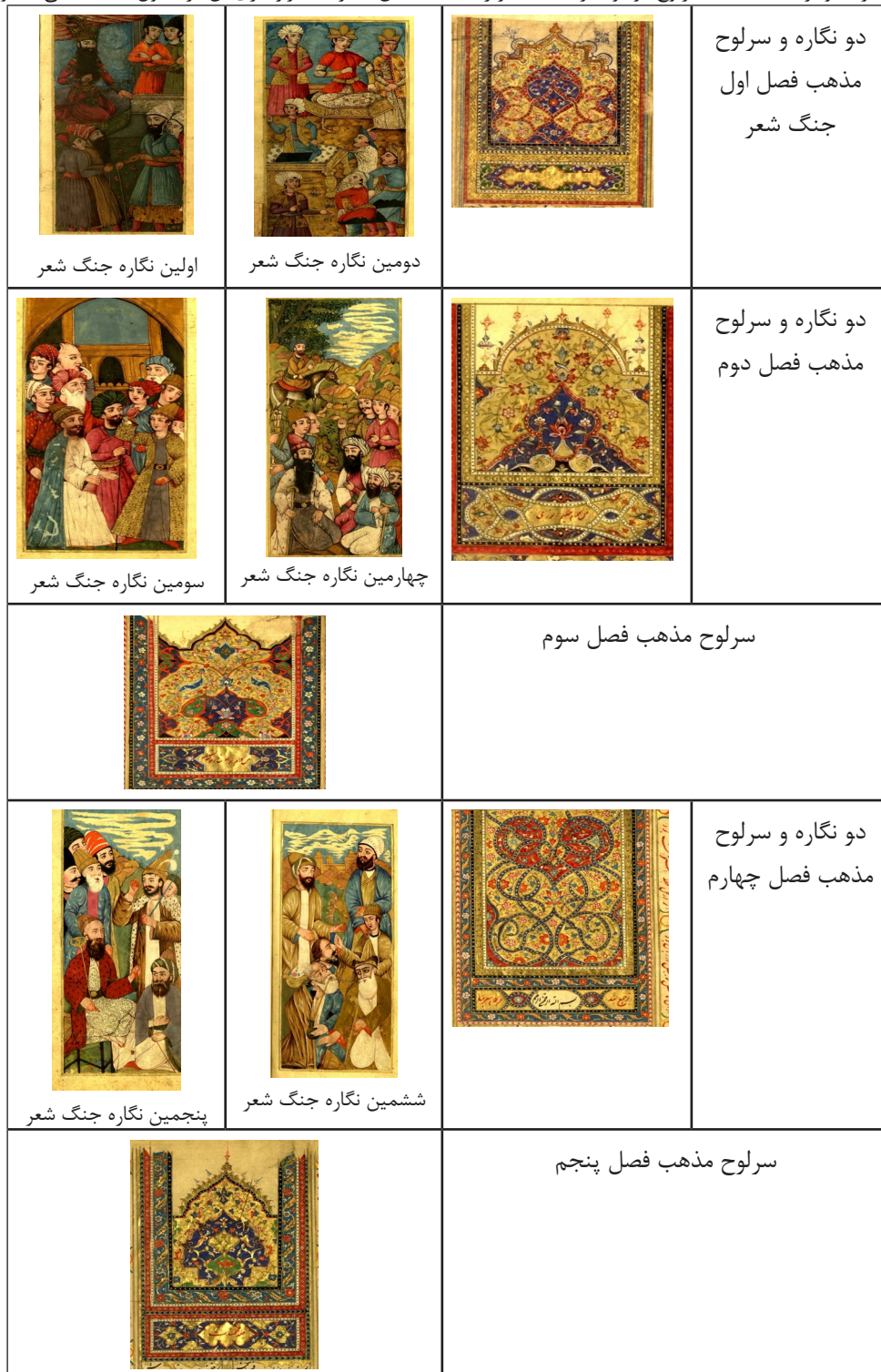
اولین نگاره جنگ شعر

جدول ۵: نگاره‌ها و تزیینات مذهب سرلوح موجود در جنگ شعر زده‌المنتخبین به ترتیب قرارگیری آن در فصول نسخه خطی مذکور (نگارنده)