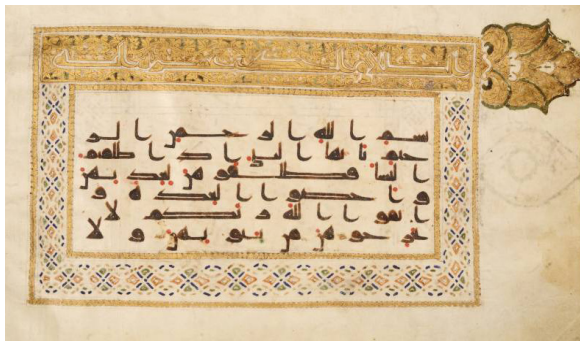
تصویر ۷: قرآن کریم به خط کوفی بر پوست آهو