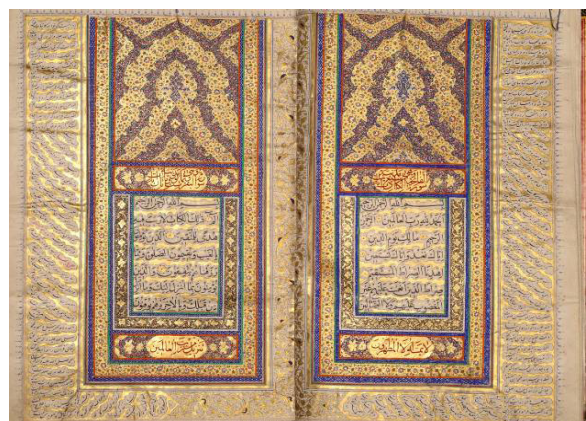
تصویر ۶: قرآن کریم به خط نسخ، رقم «بنت الشهنشاه ضیاء السلطنه دختر فتحعلی شاه سنه ۱۲۴۴ هـ.ق»

(مآخذ: گنجینه اسلامی موزه ملی ایران، شماره موزه ۴۲۳۹)