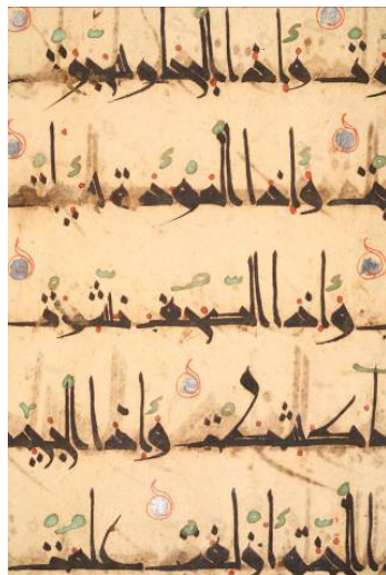
تصویر ۸: برگی از نسخه قرآن کریم به خط کوفی ایرانی و سر سوره هایی به خط ثلث