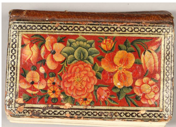
تصویر ۱۰: جلد لاک‌پشت (رنگ و روغن) قرآن کریم

دوازدهم هـ. ق. رشح‌های از نفوذ اروپایی در هنر ایران قابل تشخیص است و در تذهیب آن هنگامی است که «نقش‌مایه» کاکل نی شروع به شباهت یافتن با تزیین «برگ کنگری» می‌کند (برند، ۱۳۷۴: ۲۴۲). در این دوره به «هنر تذهیب اهمیت زیادی داده می‌شد هنرمندان با الهام از سبک‌های متداول در زمان‌های پیشین خود سبک‌های نوینی را ابداع نمودند» (پاک‌سرشت، ۱۳۷۹: ۴۳۷) و سرلوح‌های پیشانی صفحه دارای نقشی به صورت ترنج است که در میان محل مربعی جای گرفته و نقش بالا را از متن مجزا می‌سازد، کتیبه سر سوره در زیر آن نوشته شده و حایز اهمیت سابق نمی‌باشد؛ از مشخصات سبک تذهیب این دوره افراط در به کار بردن زر است که در صورت ترکیب با الوان دیگر زمینه نقش را تشکیل می‌دهد و به جای نمایش نیم ترنج‌های لاجوردی زمان صفویه تنها به ترسیم خط پیچداری که حدود آن را تعیین می‌نماید می‌پردازد و از طرف دیگر گل‌های کوچک رنگارنگ، شاخ و برگ نازک و مجزا از هم به هیچ وجه از درخشندگی زر نکاسته است (ناصری، ۱۳۷۰). از قرآن‌های گنجینه اسلامی موزه ملی ایران می‌توان به قرآن‌هایی با شماره موزه‌های ۸۵۸۴ به خط نسخ (تصویر ۶) ۳۷۵۰ به خط غبار و ۴۲۳۹ به خط نسخ (تصویر ۵) اشاره کرد.