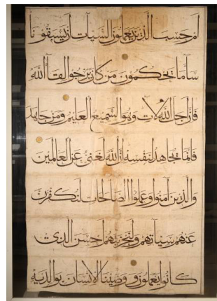
تصویر ۱۱: برگی از قرآن به قلم بایسنقر میرزا (مأخذ: گنجینه اسلامی موزه ملی ایران)

تکامل و اوج هنر جلدسازی ایران، در دوره تیموریان است؛ از آثار نفیس دوره تیموری قرآن عظیم و نفیسی است که به قلم «بایسنقر میرزا» شاهزاده تیموری کتابت شده است و یک برگ آن در موزه ملی ایران نگهداری می‌شود. ابعاد این قرآن، تقریباً ۱۲۰ × ۲۰۰ سانتی‌متر است و گویا آن را برای آرامگاه شاهرخ میرزا کتابت کرده بودند (تصویر ۱۱). در دوره تیموری جلد‌های نفیسی که آن را «معرق» گویند رواج داشته است که نمونه‌هایی از آن در کتابخانه شاهرخ‌ی تولید می‌شده است. قسمت بیرونی جلد‌های این دوره معمولاً طلاپوش می‌شده و قسمت داخلی دارای تکنیک معرق بوده به صورتی که داخل جلد را با چرم‌های نازک که به صورت تکه تکه بریده شده بود، در زمینه الوان می‌چسبانند. گاهی این معرق‌ها به رنگ قهوه‌ای سوخته همانند مویرگ‌های نازک بریده می‌شد و گاهی هم آن‌ها را آغشته به زری می‌کردند.