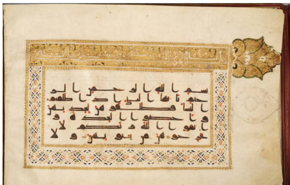
تصویر ۱: قسمتی از قرآن کریم به خط کوفی بر پوست آهو، دارای رقم

شده است. در صدر اسلام با انتخاب خط کوفی به عنوان خط کتابت قرآن، دوران ترقی و تکامل آن آغاز گردید و از برکت قرآن کریم به کمال رسید. خط کوفی، ریشه تمام خطوط اسلامی است (تصویر ۱). قرآن شماره موزه (۴۲۷۹). در قرن چهارم خط پیرآموز در کتابت قرآن رواج یافت که برگرفته از خط کوفی و معروف به کوفی ایرانی می‌باشد؛ بعد از خط کوفی، اقلام سته و در بین اقلام سته خطوط نسخ، ثلث، محقق و ریحان بیشترین کاربرد را در کتابت قرآن داشته‌اند.