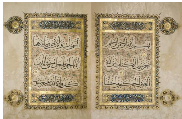
تصویر ۳: قرآن به خط محقق رقم احمد بن سهروردی، قرن ۸ هـ.ق.