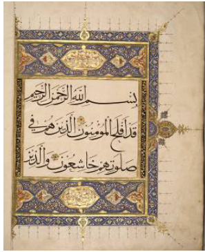
تصویر ۴: قرآن به خط محقق رقم عمادالمحلاتی و عماد بن حاجی محمد القمی، قرن ۹ هـ.ق.

(ماخذ: گنجینه اسلامی موزه ملی ایران، شماره موزه ۳۶۴۵)