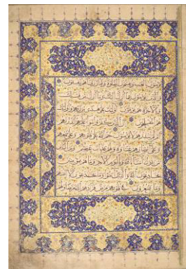
تصویر ۲: قرآن به خط ریحانی رقم یاقوت مستعصمی به تاریخ ۶۸۵ ق.