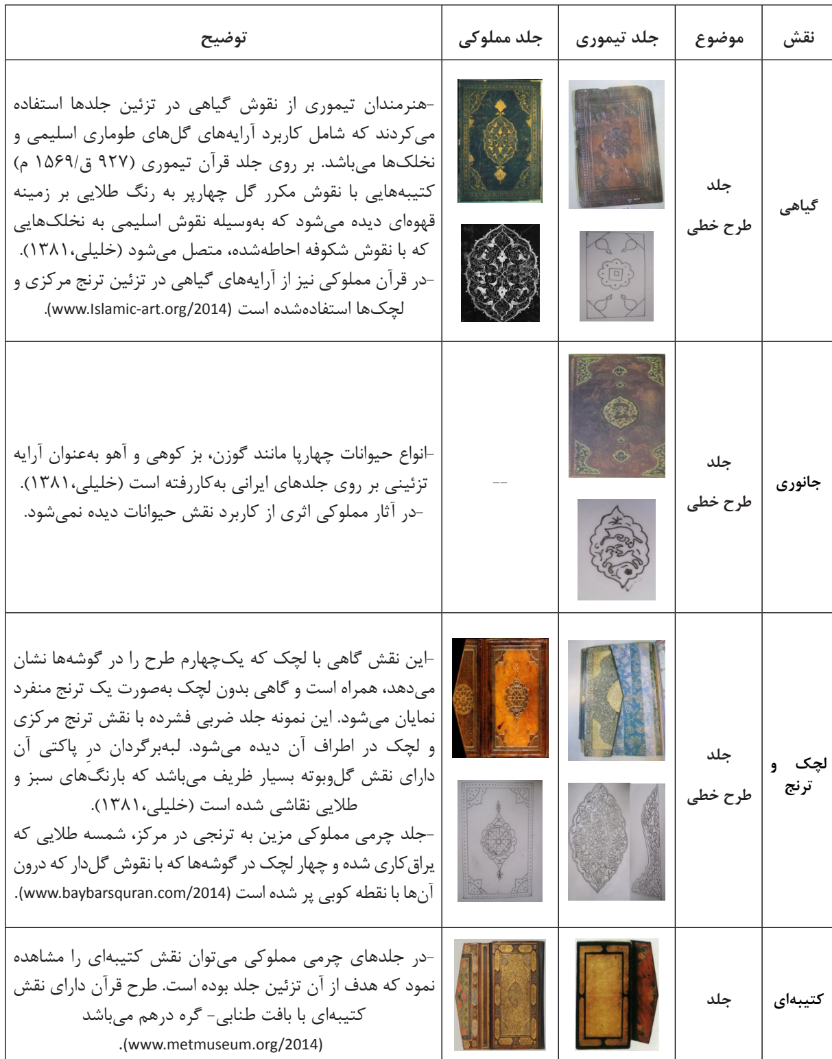
جدول ۲: نقوش تزئینی جلدهای قرآن کریم دوره تیموری و مملوکی

در جدول ۳ نیز دسته‌بندی آرایه‌هایی که در تزئین قرآن‌های دوره تیموری و مملوکی به کاررفته است، دیده می‌شود.