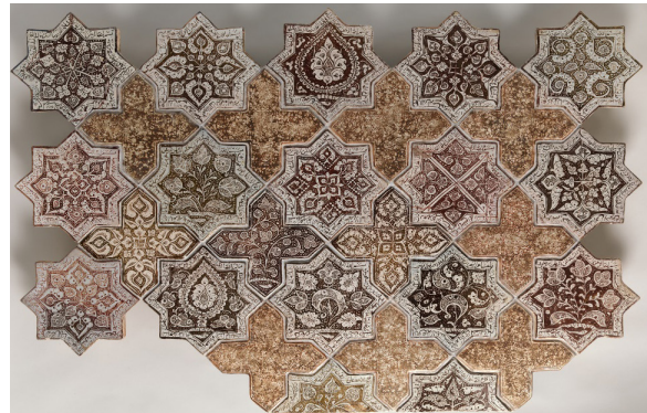
تصویر ۷: کاشی‌های زرین فام موزه متروپولیتن با تاریخ ساخت رمضان ۶۶۳ ه.ق، احتمالاً تولید کاشان (URL. 2)

(Masuya, 1993: 16 &) بدین سبب نمی‌توان بیان کرد که این کاشی‌ها در گذشته و در چه بنایی مورد استفاده قرار گرفته‌اند. بجز این مورد، کاشی‌های ستاره‌ای شکل شناخته شده در سایر ابنیه، تشابه چندانی از لحاظ نقوش تزئینی با نمونه‌های امامزاده یحیی ندارند؛ از این روی در پژوهش حاضر مطالعه مقایسه‌ای با آنها صورت نگرفته است.