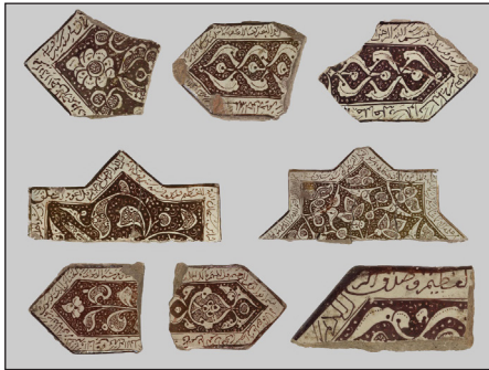
تصویر ۴: نمونه‌هایی از قطعات کاشی زرین‌فام موزۀ ارمیتاژ که احتمالاً متعلق به بنای امامزاده یحیی ورامین باشند (منبع: URL. 5؛ چیدمان تصاویر توسط نگارندگان، ۱۴۰۲)

کاشی‌های ستاره‌ای شکل بنای امامزاده یحیی ورامین از یک جنبه کاملاً شاخص بوده و با نمونه‌های مشابه در سایر ابنیه متفاوت هستند و آن ابعاد آنها است. ابعاد کلی این کاشی‌ها 31 \times 31 سانتی‌متر است (Masuya, 2000: 44)؛ در حالی که معمولاً کاشی‌های ستاره‌ای شکل زرین‌فام در ایران ابعاد 21 \times 21 سانتی‌متر یا بعضاً کوچک‌تر دارند (قوچانی، ۱۳۹۷: ۱۰). بدین سبب از لحاظ اندازه این کاشی‌ها کاملاً شاخص و متفاوت با نمونه‌های مشابه دیگر هستند. نکته دیگری که در ارتباط با این کاشی‌ها باید بیان شود آن است که تمامی نقوش به کار رفته در آنها به صورت تک‌رنگ زرین یا طلایی بوده و هیچ رنگ دیگری هم‌چون فیروزه‌ای یا لاجوردی، در آنها استفاده نشده است؛ موضوعی که عملاً در بسیاری از کاشی‌های مشابه دیگر کمتر به چشم می‌خورد.