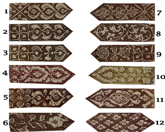
تصویر ۷: انواع نقوش گیاهی به کار رفته در کاشی‌های چلیپایی شکل بنای امامزاده یحیی

کاشی‌ها تکرار شده‌اند. در این میان تکرار یک نقش خاص گیاهی یا اسلیمی روی کاشی‌های چلیپایی شکل بیشتر از نمونه‌های هشت‌گوشه است. بر همین اساس باید به این نکته اشاره شود که در بررسی صورت گرفته روی کاشی‌های چلیپایی شکل این بنا، حداقل ۱۲ نقش مختلف گیاهی و اسلیمی مورد شناسایی قرار گرفت که در تصویر ۴ مشخص شده‌اند. در میان این نقوش حداقل شش نقش از فراوانی بیشتری نسبت به باقی نمونه‌ها برخوردار هستند (سه ردیف اول تصویر ۵). در پیرامون این نقوش نیز از طرح‌های بسیار کوچک نقطه‌ای، هلالی یا ویرگولی شکل به‌عنوان عناصر پرکننده طرح استفاده شده است. این شیوه پرکننده نقش، یکی از نشانه‌های شاخص سبک کاشی‌کاری کاشان در تولید سفال و کاشی زرین‌فام طی قرون ۶ تا ۸ ه.ق است (Pope, 1939: 1594 و Ettinghausen, 1936: 45). معمولاً در وسط این کاشی‌ها نیز برای اینکه برخی نقوش تکرار شوند به یک مرکز منتهی شده و از یک‌دیگر به نحوی تفکیک شوند، از نقوشی هم‌چون گل چهار برگ یا نقش ضربدری شکل استفاده کرده‌اند؛ موضوعی که تقریباً در بیشتر کاشی‌های چلیپایی مطالعه شده این بنا ملاحظه گردید.