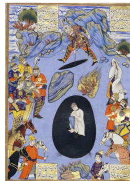
تصویر ۴: نجات بیژن از چاه توسط رستم، شاهنامه قرقچای خان.

«برهنه تن و موی و ناخن دراز گدازیده از درد و رنج و نیاز همه تن پُر از خون و رخساره زرد از آن بند و زنجیر زنگار خورد» (همان).