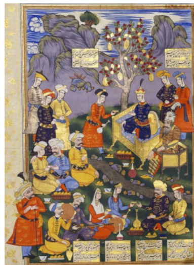
تصویر ۲: حضور رستم در بارگاه کیخسرو و چاره‌جویی برای آزادی بیژن، شاهنامه قرچقای خان