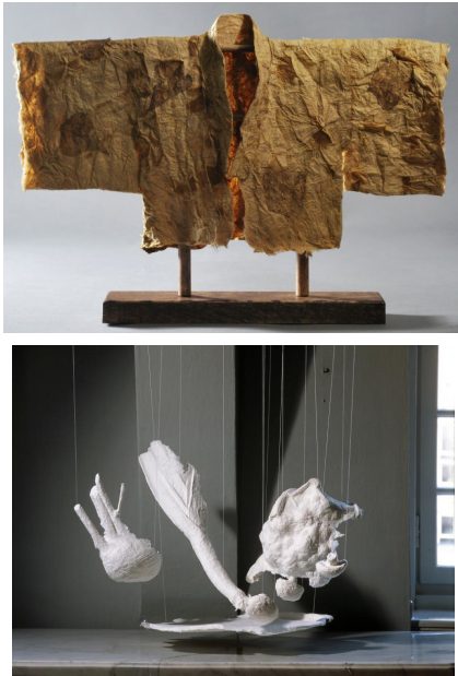
تصویر ۱: نمونه آثار هنرمندان کاغذساز انجمن بین‌المللی کاغذسازان و هنرمندان کاغذ (URL1)