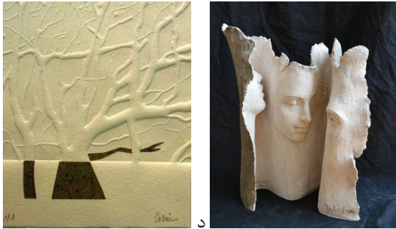
تصویر ۳: نمونه کاغذهای دست‌ساز: الف. دکوراسیون داخلی؛ ب. چاپ دیجیتال؛ ج. استفاده از خمیر کاغذ در مجسمه‌سازی؛ د. کاغذ واترمارک متناسب با چاپ دستی (URL3)