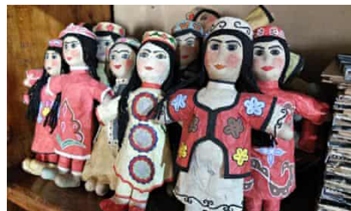
تصویر ۲: کاغذهای دست‌ساز و محصولات تهیه‌شده از کاغذهای دست‌ساز کارگاه ظریف مختاروف (URL2)

همه نمونه‌های اشاره‌شده در مقوله‌های فوق، این مسئله مهم را تبیین می‌کند که می‌توان دانش بومی کاغذسازی