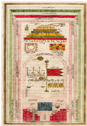
تصویر ۸: برگه‌ای از نقشه عوالم کیهانی و جایگاه درخت سدره المنتهی در بالا و درخت زقوم در پایین عالم، کتاب معرفت نامه، ابراهیم حقی ارزرومی، احتمالاً استانبول، ۱۲۳۷ ه.ق. / ۱۸۲۲ م.، کلکسیون ویژه، کتابخانه دانشگاه میشیگان. (URL3)

توصیفات قرآنی به همراه احادیث و روایات اسلامی از درختان مقدسی که ذکر آن به میان آمد، و عناصر دیگری از تمثیل‌های مذهبی در کتاب‌هایی با موضوعات آخرالزمانی، تصورات و مفاهیم جدیدی از زمان و مکان به عنوان تقسیم بندی قلمروهای آخرالزمانی و رخدادها، در کتاب‌های زیارتی اماکن مقدس اسلامی و نیز کیهان شناسی‌های عرفانی و علمی از اواسط دهه ۹۵۰ تا حدود ۱۳۰۰ هجری توسعه یافت. در طول و بعد از قرن دهم هجری قمری، تصاویر