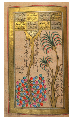
تصویر ۲: نگاره درخت طوبی همانند درخت باژگون، کتاب دعای ترکی، ۱۲۱۳ ه. ق. ۱۷۹۸ میلادی، ۱۷،۷x۱۱،۲ سانتی متر، کتابخانه چستربیتی، برگه T ۴۶۳ r. ۹۸. (URL)

صفت ایجاد، ابقاء و افناء هستند و پنج شاخه آن مجموعه‌ای از عناصر اربعه را تشکیل می‌دهند» (زمردی، ۱۳۸۷: ۱۱۰). بیرونی در اثر مشهور خود «تحقیق ماللهند» در باره درخت باژگون می‌گوید: «و ابروقلس ۳ گفت که جرمی که نفس ناطقه پیش از شکل‌گیری بدان درآید همچون اثر است و اشخاص آن؛ و آنکه آن و غیرناطقه پیش از استقامت بدان درآید همچون انسانی است و آنکه تنها غیرناطقه پیش از استقامت بدان درآید به گونه‌هایی، حیوان غیرناطق است؛ و آنکه از این هر دو خالی ماند و جز قوه غاذیه [قوتی که غذا را تحلیل کند و جزو بدن سازد] پیش از استقامت در آن پدیدار نیاید و انحاء آن به سرنگونی تمامت پذیرد و راس آن در زمین منغرس [کاشته شده] باشد همچون گیاه است برخلاف انسانی، که انسانی درختی است آسمانی و اصل آن به سوی مبدأ او است که آسمان است بدانگونه‌ای که نیز اصل گیاه به سوی مبدأ آن است که زمین است. هندوان را نیز در طبیعت، مذهب مانده به دین است: ارجن ۴ گفت چگونه است مثال «براهم» در عالم، و باسدیو ۵ پاسخ داد که او را درخت «اشوت» توهم کن و آن شناخته است به نزد آنان و از بزرگترین درخت هاست و آزادترین آن به وضع معکوس، ریشه‌های آن به بالا است و شاخه‌های آن به پایین و غذای آن از غزارت، غلیظ است و شاخه‌های آن منبسط است و آویخته بر روی زمین و ریشه‌ها و شاخه‌های آن از رهگذر همانندی مشتبه به هم. و براهم از این درخت است و ریشه‌های والا و ساق آن «بید» [دانایی] است و شاخه‌های آن آراء و مذاهب و برگ‌های آن وجوه و تفاسیر» (بیرونی، بی تا: ۶۲-۶۳).