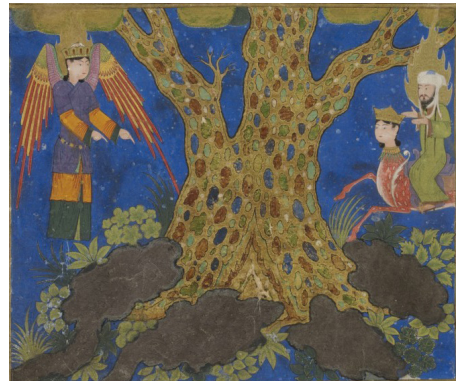
تصویر ۵: درخت سدره المنتهی، هرات، معراجنامه میرحیدر، سده نهم ه.ق. کتابخانه ملی فرانسه، پاریس. (رزسگای، ۱۳۸۵: ۹۸)

درخت سدره المنتهی بندرت در تصویرسازی نسخ یا در تک برگ‌های نگارگری به نمایش درآمده است، یکی از منحصر بفردترین آنها، در معراج نامه میرحیدر تصویر شده است. جبرئیل، پیامبر(ص) را که بر روی مرکب خود براق نشسته است به سوی مکان قرارگیری این درخت هدایت می‌کند و درخت سدره المنتهی با تنه‌ای بسیار حجیم در آسمان قرار گرفته است (تصویر ۷). لکه‌هایی به رنگ‌های مختلف بر روی آن نقش بسته که چشم بیننده را به سوی بالا و خارج از کادر هدایت می‌کند و استعاره‌ای از عرش و مکانی دست نیافتنی در ورای کادر تصویر است.