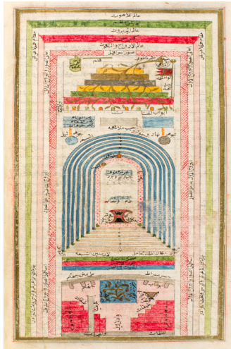
تصویر ۷: نقشه عوالم کیهانی و جایگاه درخت سدره المنتهی در بالا و درخت زقوم در پایین عالم، کتاب معرفت نامه، ابراهیم حقی ارزرومی، احتمالاً استانبول، ۱۲۳۷ ه.ق. / ۱۸۲۲ م.، کلکسیون ویژه، کتابخانه دانشگاه میشیگان. (URL3)