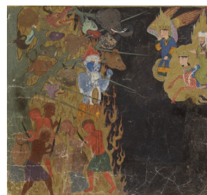
تصویر ۱: معراج نامه، درخت زقوم در دوزخ، هرات، معراجنامه میرحیدر، سده نهم ه.ق، ۱۴۳۶ میلادی. کتابخانه ملی فرانسه، پاریس. (رزسگای، ۱۳۸۵: ۷۵)