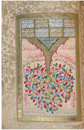
تصویر ۳: نگاره درخت طوبی همانند درخت باژگون، کتاب دعای ترکی، ۱۲۱۳ ه. ق. ۱۷۹۸ میلادی، کتابخانه چستربیتی، برگه T ۴۶۴ r. ۱۰۲. (URL)

تصویر درخت طوبی همچون سایر درختان مقدس اسلامی، در نسخه آرابی‌ها و تصویرسازی نسخ، بسیار اندک کار شده است. دو برگه نقاشی شده از آن که نسخه‌ای ترکی از کتاب دعا را مزین کرده است آن را در مقام درخت واژگون نشان می‌دهد. تاریخ این نگاره‌ها مربوط به سال ۱۲۱۳ هجری قمری است کاتب آن احتمالاً محمد امین الرشیدی معروف به حافظ القرآن است؛ این آثار در کتابخانه چستر بیتی نگهداری می‌شود. در یکی از نگاره‌ها (تصویر ۲) درخت واژگون طوبی به صورت معلق در کنار درخت نخلی ترسیم شده است.