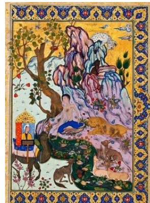
تصویر ۶: لیلی و مجنون، مظفرعلی، پنج گنج، ۹۲۸ هـ.ق، کاخ گلستان (کرباسی و دیگران، ۱۳۸۹: ۱۱۴)

سپید به عروسیش نزدیک و به پشت سر بر می‌گردد تا دیس طلایی را از یکی از ملازمان بگیرد، تا یک سنت کهن ایرانی را که در جشن عروسی طلا، نقره، مروارید و جواهر می‌پاشند، اجرا کند. نوازندگان آلات مختلف موسیقی می‌نوازند و دو پسر با قاشق برای زلیخا می‌رقصند (شعبان‌پور، ۱۳۸۲: ۸۸).