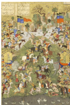
تصویر ۴: جنگ بین بهرام چوبینه و خسرو پرویز، خسرو و شیرین نظامی، هنرمند نامعلوم، سده ۱۰ هـ.ق، موزه سلطنتی اسکاتلند، ادینبرا (گری، ۱۳۸۳: ۲۱۵)