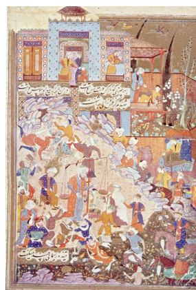
تصویر ۱۱: یوسف در بازار، یوسف و زلیخا جامی، هنرمند نامعلوم، مشهد، سده ۱۰ هـ.ق، موزه بریتانیا، لندن (گری، ۱۳۸۳: ۲۲۰)

جمشید پس از تهمورث در روز هُرمُزد از فروردین به تخت پادشاهی نشست و مردم آن روز را "نوروز" خواندند. جمشید هم پادشاه بود و هم رهبر دینی. او ذوب کردن آهن و ساختن ابزار، بافتن، ریسیدن و خانه‌سازی به شکل هندسی و... را به مردم آموخت و برای جابه‌جاشدن، تخت روانی تهیه کرد و دیوان را مأمور حمل آن ساخت. در نگاره "حمل دیوان، تخت روان جمشید را" مربوط به مکتب شیراز دوره تیموری، صحنه حمل تخت باشکوه جمشید توسط دیوان به تصویر درآمده‌است (تصویر ۱۲). در نگاره "سلیمان و بلقیس" از مکتب تبریز دوره صفوی صحنه ملاقات سلیمان با ملکه سبا تصویر شده‌است. در این تصویر تخت سلیمان توسط اجنه و دیوان حمل می‌شود و تخت بلقیس نیز توسط دیوان نزد سلیمان حاضر شده‌است (تصویر ۱۳).