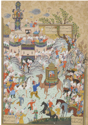
تصویر ۸: ورود عزیز و زلیخا به مصر و استقبال مصریان از ایشان، منسوب به شیخ محمد، نسخه مصور از هفت اورنگ جامی 1492D، ۹۶۳ تا ۹۷۲ هـ.ق (کرباسی و دیگران، ۱۳۸۹: ۳۴).