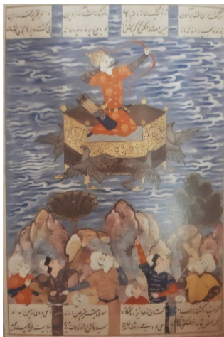
تصویر ۹: کیکاووس در آسمان، شاهنامه، هنرمند نامعلوم، ۹۵۵ هـ.ق، مجموعه سامفگ، لندن (رضوی، ۱۳۹۶: ۲۹)

نگاره "شکار شاهی" مربوط به مکتب قزوین دوره صفوی صحنه شکار شاه را به تصویر می‌کشد؛ درحالی‌که حلقه جرگه-کنندگان شکارها در چندقدمی شاهزاده تشکیل یافته و سلیقه نگارگر درباری کار خود را کرده و به چابکی صحنه کشتار را در ماهیت کارناوال شادی بخشی نشان داده‌است (تصویر ۱۰). نگاره "یوسف در بازار" مکتب مشهد دوره صفوی تصویرگر داستان فروش یوسف در بازار مصر می‌باشد. در این نگاره یوسف در میان جمعیت نشسته و خریداران وی، در حال مشورت برای خرید او هستند؛ درحالی‌که زلیخا دورتر در کجاوه مجلل خود نظاره‌گر این صحنه است (تصویر ۱۱).