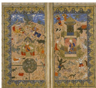
تصویر ۱۳: سلیمان و بلقیس، خمسه نظامی، هنرمند نامعلوم، ۹۳۵ هـ.ق، کتابخانه چستربیتی، دوبلین، ایرلند جنوبی (لوکونین و ایوانف، ۱۳۹۱: ۳۴)