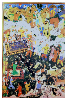
تصویر ۱۰: شکار شاهی، منتسب به علی‌اصغر، از شاهنامه‌ای به احتمال به نام شاه‌اسماعیل دوم، قزوین، ۹۸۵-۹۸۴ هـ.ق، مجموعه خصوصی (کوریان و دیگران، ۱۳۷۷: تصویر ۷۵-۷۴)

در نگاره‌های مورد بررسی، افرادی که درون کجاوه رسم شده‌اند همگی اشراف‌زاده و جزو طبقات متمول جامعه هستند و شاهدخت، شاهزاده، پادشاه یا از ثروتمندان جامعه می‌باشند. جدول ۲، شامل اطلاعاتی مربوط به نگاره‌ها و بررسی شیوه حمل کجاوه و نیز شخصیت‌های درون کجاوه‌هاست.