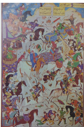
تصویر ۵: جنگ بین گو و تلخند، شاهنامه محمد جوکی، هنرمند نامعلوم، هرات، سده ۹ هـ.ق، انجمن سلطنتی آسیایی، لندن (همان: ۱۹۳)