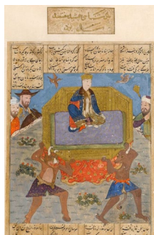
تصویر ۱۲: حمل دیوان تخت روان جمشید را، شاهنامه، هنرمند نامعلوم، شیراز، ۸۸۴ هـ.ق، کتابخانه ملی پاریس (آژند، ۱۳۸۷: ۲۷۱)