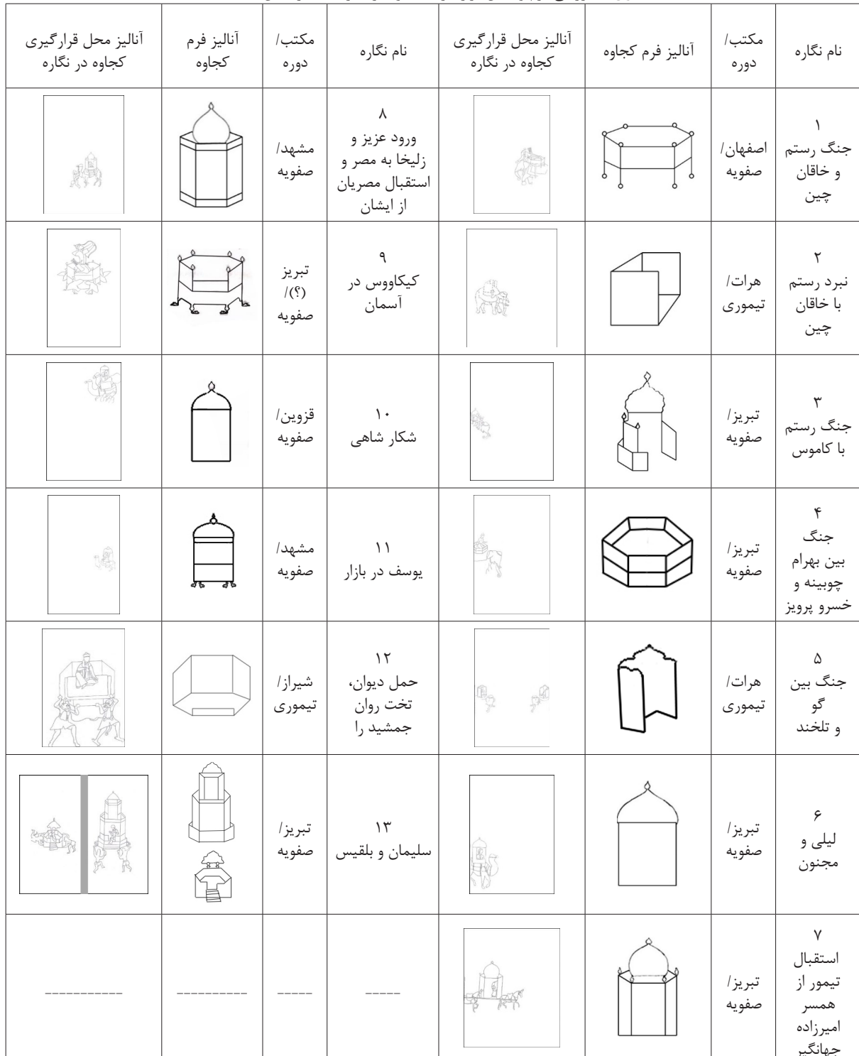
جدول ۴: بررسی فرم و محل قرارگیری کجاوه در نگاره‌ها (نگارندگان، ۱۳۹۸)