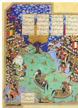
تصویر ۳: جنگ رستم با کاموس، شاهنامه شاه طهماسبی، منسوب به عبدالوهاب، سده ۱۰ هـ.ق، موزه هنرهای معاصر تهران (کرباسی و دیگران، ۱۳۸۹: ۲۸۷).

"گو" در شاهنامه نام پسر جمهور شاه هند است. گو چون به سن جوانی رسید، خود را شایسته پادشاهی دانست و به همین سبب میان او و برادرش تلخند اختلاف و جنگ درگرفت. گو خواهان آشتی با برادرش بود؛ اما وی نپذیرفت و به جنگ ادامه داد تا در میانه نبرد بر پشت فیل جان سپرد. گو نگران بود که چگونه این خبر را با مادرشان بازگوید. سرانجام چاره‌ای اندیشید و بزرگان قوم خویش را بر آن داشت تا صحنه کارزار او و برادرش را بر تخته شطرنج بیارایند و این صحنه را به مادر نشان دهند تا او از چگونگی مرگ تلخند آگاه شود. مادر بدین وسیله دانست که فرزندش تلخند بر پشت فیل و بدون هیچ زخمی بر بدنش در گذشته‌است. نگاره جنگ بین "گو و تلخند" مربوط به مکتب هرات دوره تیموری، نمایانگر این واقعه است (تصویر ۵).