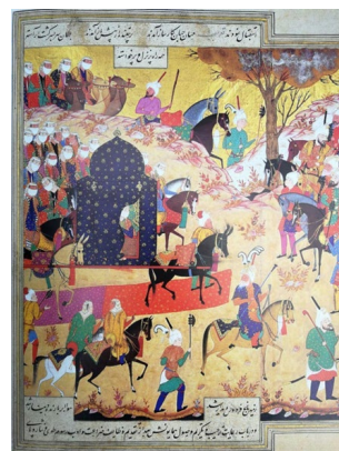
تصویر ۷: استقبال تیمور از همسر امیرزاده جهانگیر، منسوب به کمال‌الدین بهزاد، ظفرنامه تیموری (شماره ۷۰۸)، ۹۳۵ هـ.ق، کاخ گلستان (همان: ۸۶)

نگاره "کیکاووس در آسمان" مکتب تبریز (؟) دوره صفوی به پادشاه کیانی به نام کیکاووس مربوط می‌شود که توسط ابلیس گمراه و مطیع او شده‌است؛ چنانکه پادشاه در تلاشی برای مغلوب ساختن آسمان‌ها، توسط شیطان اقدام به ساخت تختی پرنده نمود که توسط چهار عقاب قوی حمل می‌شد. بر این اساس پرندگان طی پرواز به سمت گوشت آویخته در بالای سر خود، تاج و تخت را به سمت بالا می‌برند. هنگامی که پرندگان خسته شدند به همراه تاج و تخت به زمین فرو افتاده و کیکاووس، خسته و پشیمان، به خاطر غرور خود از خداوند منان طلب آمرزش می‌نماید (تصویر ۹).