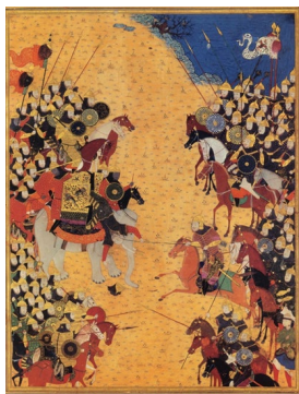
تصویر ۲: نبرد رستم با خاقان چین، هنرمند نامعلوم، شاهنامه بایسنقری، ۸۳۳ ه.ق، کاخ گلستان (همان: ۴۸)