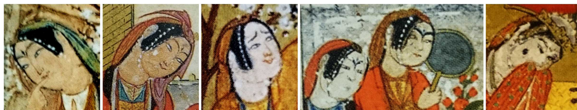
تصویر ۲: نمونه‌هایی از چهره زنان در نقاشی جنید (خواجوی کرمانی، ۱۳۹۳).