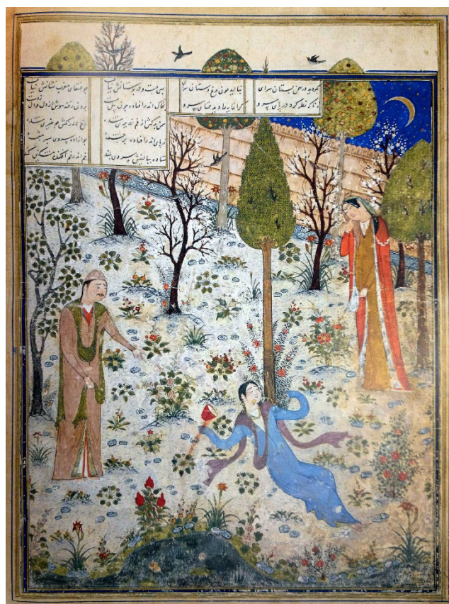
تصویر ۵: نگاره پیدا شدن بهزاد در باغ به‌وسیله همای و آذرافروز، تطابق حالات پیکره‌ها با متن داستان (خواجهی کرمانی، ۱۳۹۳: ۲۲).