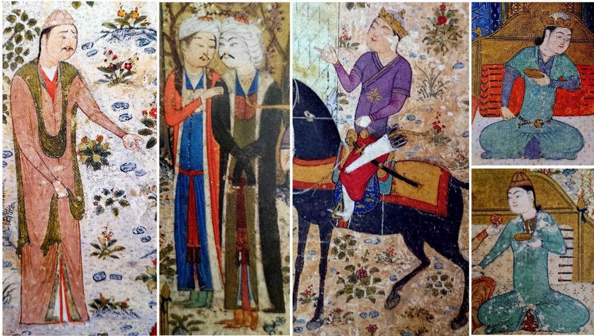
تصویر ۳: نمونه‌هایی از پیکره مردان در نقاشی جنید (خواجوی کرمانی، ۱۳۹۳).