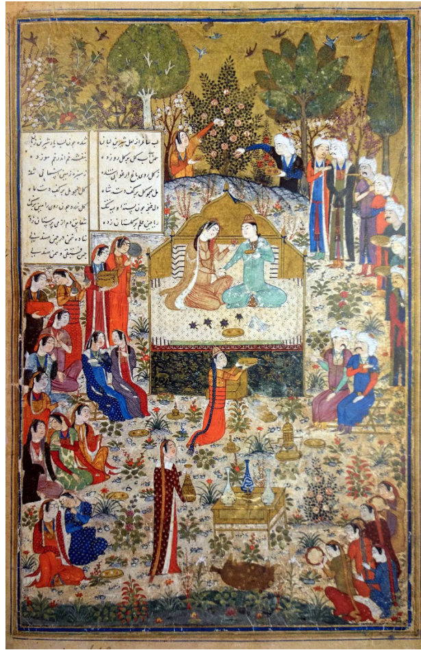
تصویر ۶: نگاره همایون و همای در باغ در حال جشن و سرور، تطابق حالات پیکره‌ها با متن داستان (خواجوی کرمانی، ۱۳۹۳: ۸۴).

در پنجمین نگاره از این نسخه به نام «همایون و همای در باغ در حال جشن و سرور» (تصویر ۶) قدح در دست گرفتن همای و نگاه خیره او به همایون، بیان کننده بیت ششم از بخش «صفت بزم شاهزاده همایون به سمن زار نوشاب و صفت ریاحین» است: به روی همایون قدح نوش کرد / خرد را به یک جرعه بیهوش کرد