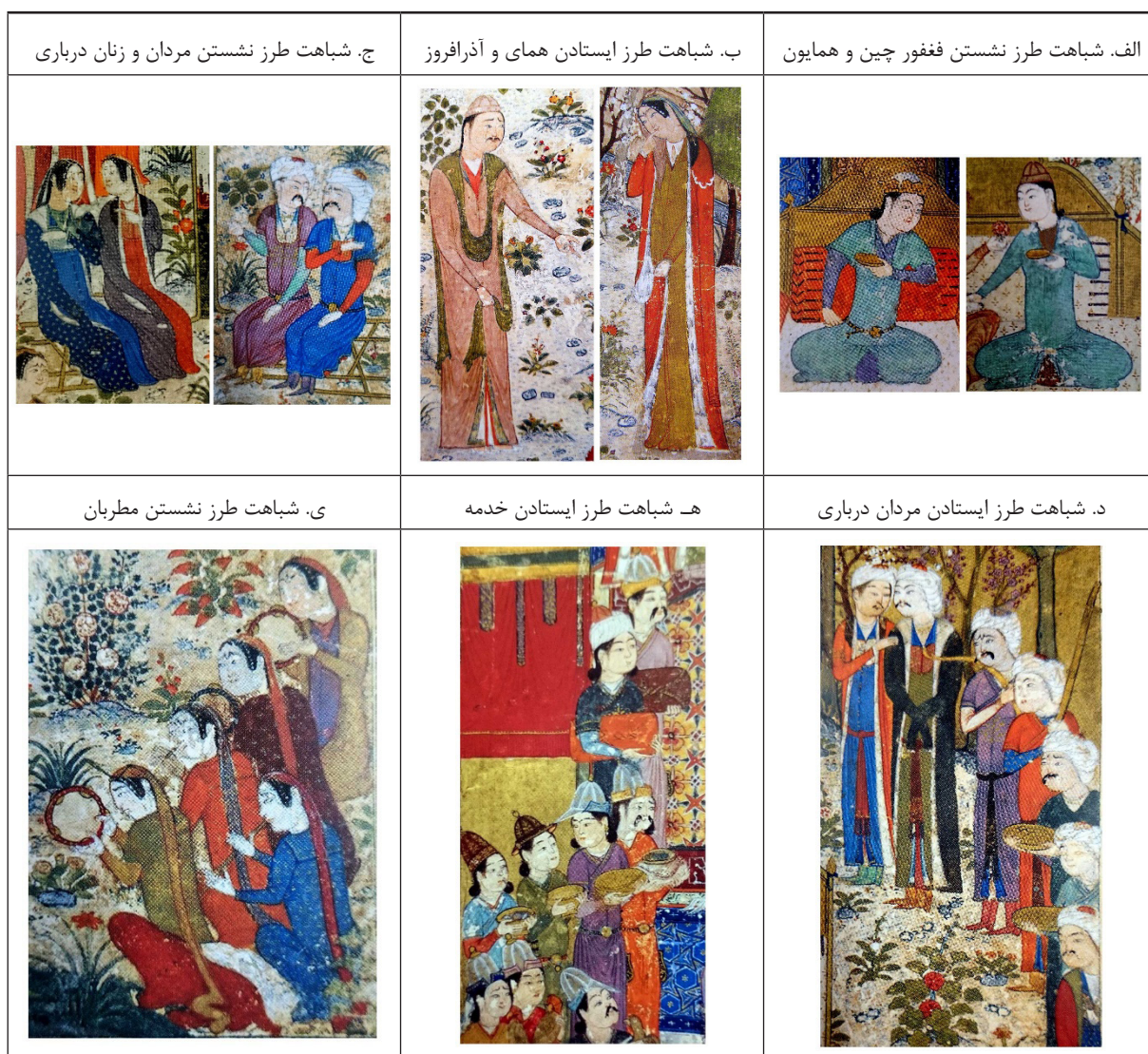
جدول ۳: شباهت حالات پیکره‌ها در آثار جنید(خواجوی کرمانی، ۱۳۹۳).