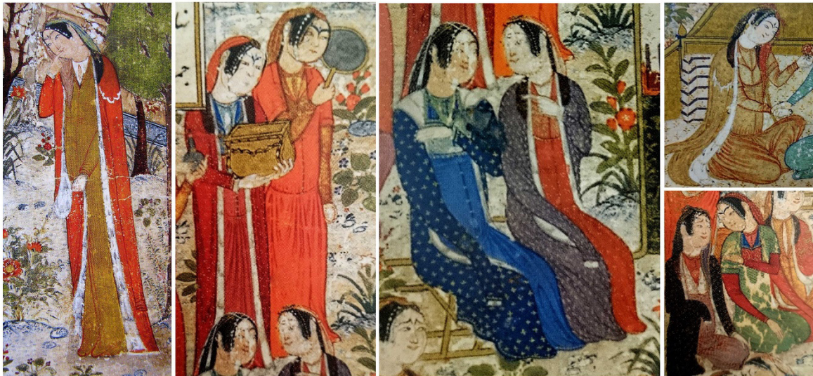
تصویر ۴: نمونه‌هایی از پیکره زنان در نقاشی جنید (خواجوی کرمانی، ۱۳۹۳).