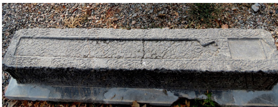
تصویر ۲: شکل محرابی سنگ قبر دوره صفوی موجود در مجموعه هارونیه (نگارندگان، ۱۳۹۶).

از جمله نقوش مورد استفاده در سنگ قبرهای موجود در ایران، دو شکل محرابی و صندوقی‌اند که هر دو دارای پیشینه معماری بوده و بیشتر در قالب شکل کالبدی قبور و هم‌چنین کادرهای محرابی نمایان شده‌اند. طرح محراب نمادی از یک معماری جهانی است (صفی‌خانی و دیگران، ۱۳۹۳: ۷۸). در قرآن کریم نیز از محراب به‌عنوان یک جایگاه مقدس نام برده شده است. محراب در زبان عربی به معنی حربگاه و در فارسی به معنی محل نیایش است (یاحقی، ۱۳۷۴: ۱۳۱۹). این نقش مستطیل‌شکلی که به صورت روی هم چسبیده یا جداگانه بر روی سنگ قبرها طراحی شده، در یک قسمت از آن آیه، حدیث یا سال و مشخصات فرد متوفی ثبت شده و در قسمت دیگر آن که بزرگ‌تر است نقش و نگارهای مختلفی نقش بسته است. در قرن دهم و یازدهم هجری نقوش هندسی از مهارت و وجاهت برخوردار بوده و نیز گل‌های چندپر که نمادی از زندگی و چرخش خورشید بوده است.