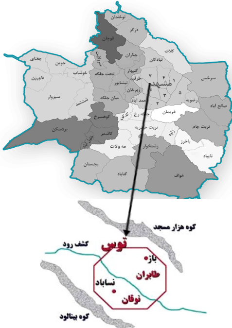
نقشه ۱: موقعیت جغرافیایی شهر توس.

دارد. این شهرستان بین مدار جغرافیایی ۱۰/۳۶ تا ۲۳/۳۶ عرض شمالی و ۲۸/۵۹ تا ۴۳/۵۹ طول شرقی قرار گرفته است. این شهرستان دارای سه بخش، یازده دهستان و سه شهر است ( http://www.webcitation.org ).