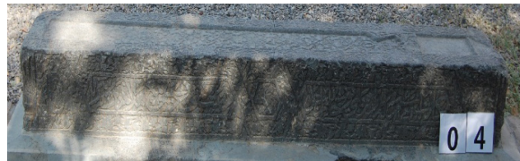
تصویر ۹: سنگ قبر دوره صفوی محفوظ در مجموعه هارونیه.

نکته دیگر در حوزه تزیینات، کتیبه‌های نقش‌بسته بر سنگ قبور هستند. آنچه در خصوص نوع خطوط لازم است اشاره گردد، این که عمده خطوط به کار رفته بر سنگ‌های دوره تیموری تعلیق و ثلث است. در دوره صفوی خط ثلث و در دوره قاجار خط نستعلیق غالب است. خط نسخ در قسمت‌های جانبی پایین و بالای سرسنگ‌ها به کار رفته است. صلابت و استواری خطوط نقش بسته بر جانبین سنگ‌ها در دوره تیموری و صفوی نسبت به دوره قاجار بیشتر است و استخوان‌بندی محکم‌تری دارد. خط حاشیه صورت قبر از اواخر صفوی ثلث و متن میانی با نستعلیق حکاکی شده است که البته در دوره قاجار همگی به خط نستعلیق نوشته شده‌اند. خط جانب سنگ‌ها در دوره قاجار به نستعلیق نگاشته شده و بعضی اوقات با ثلث کیفیت متوسط نقش بسته است.