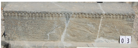
تصویر ۴: شکل صندوقی سنگ قبر دوره صفوی محفوظ در مجموعه