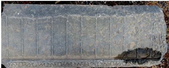
تصویر ۷: سنگ قبر دوره قاجار محفوظ در مجموعه هارونیه (نگارندگان، ۱۳۹۶).

باید گفت نذر و نیاز و آثار آن در آمرزش روح متوفی در این حفره‌ها متجلی شده است. استفاده از آب و یا گندم و ارزنی که برای پرندگان تعبیه شده، به‌نوعی خیرات برای آمرزش متوفی محسوب است. در آثار مورد بررسی قاجاری دیده شد که این گل هشت‌پر در قالب شانزده پر هم طراحی شده و قبلاً که در شمس هشت‌وجهی جای گرفته بود، اینک به ستاره تبدیل شده است. اعداد به کار گرفته شده در این آثار نشان از اعتقادات و باورها دارد؛ به‌ویژه می‌توان از عدد هشت نام برد که در گل‌ها و یا ستاره هشت بر صورت قبر، نقش شده است. در آثار متأخر که فرم‌های محرابی هندسی دارند این فرم حذف و به نقوش بزرگ ختایی شبیه گل لاله تبدیل شده و یا جایش را به کتیبه درشتی بر صورت قبر داده است (تصویر ۸).