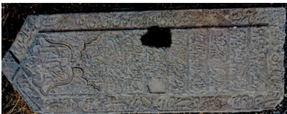
تصویر ۸: سنگ قبر دوره قاجار محفوظ در مجموعه هارونیه (نگارندگان،

باید گفت نذر و نیاز و آثار آن در آمرزش روح متوفی در این حفره‌ها متجلی شده است. استفاده از آب و یا گندم و ارزنی که برای پرندگان تعبیه شده، به‌نوعی خیرات برای آمرزش متوفی محسوب است. در آثار مورد بررسی قاجاری دیده شد که این گل هشت‌پر در قالب شانزده پر هم طراحی شده و قبلاً که در شمس هشت‌وجهی جای گرفته بود، اینک به ستاره تبدیل شده است. اعداد به کار گرفته شده در این آثار نشان از اعتقادات و باورها دارد؛ به‌ویژه می‌توان از عدد هشت نام برد که در گل‌ها و یا ستاره هشت بر صورت قبر، نقش شده است. در آثار متأخر که فرم‌های محرابی هندسی دارند این فرم حذف و به نقوش بزرگ ختایی شبیه گل لاله تبدیل شده و یا جایش را به کتیبه درشتی بر صورت قبر داده است (تصویر ۸).