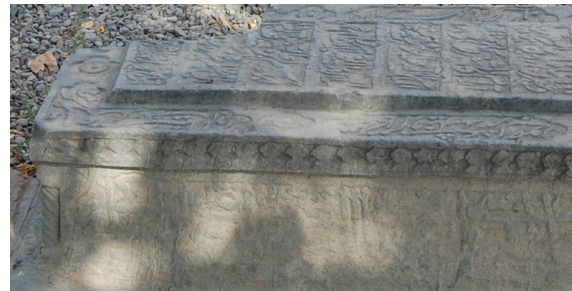
تصویر ۵: سنگ قبر دوره قاجار محفوظ در مجموعه هارونیه (نگارندگان، ۱۳۹۶).

مقرنس حجاری شده بر لبه سنگ‌ها از قرون نهم هجری رایج شد و گسترش یافت که به زیبایی بر جانب‌ها و بعضاً صورت قبر نقش بست. این عنصر تزئینی در دوره صفوی بر جانبین دیده شد و تا دوره قاجار ادامه پیدا کرد (تصویر ۴). تزئین اصلی جانب مستطیل سنگ‌ها از قرن ۹ هجری به بعد، فرم بازوبندی کشیده با گل‌های ۴ یا ۸ پر در میان آن‌هاست. این نقش به‌صورت حمیل‌دار درشت اجرا شده که حاوی ریشه گیاهی اسلیمی و یا ختایی بوده و در میان بازوبندی کتیبه کار شده است. حدفصل کتیبه تا مقرنس لبه را همین حمیل با عرض زیاد جدا کرده است. البته باید گفت در دوره صفوی علاوه بر حمیل یک حاشیه سرتاسری نیز بر زیر مقرنس لبه سنگ منقوش به اسلیمی اضافه گردیده است و در عصر قاجار بازوبندی جانب سنگ‌ها، بسیار ساده، منحصر به خطوط پیرامونی شده و خبری از تزئینات گیاهی و ترسیم دقیق هندسی نقش نیست (تصویر ۵).