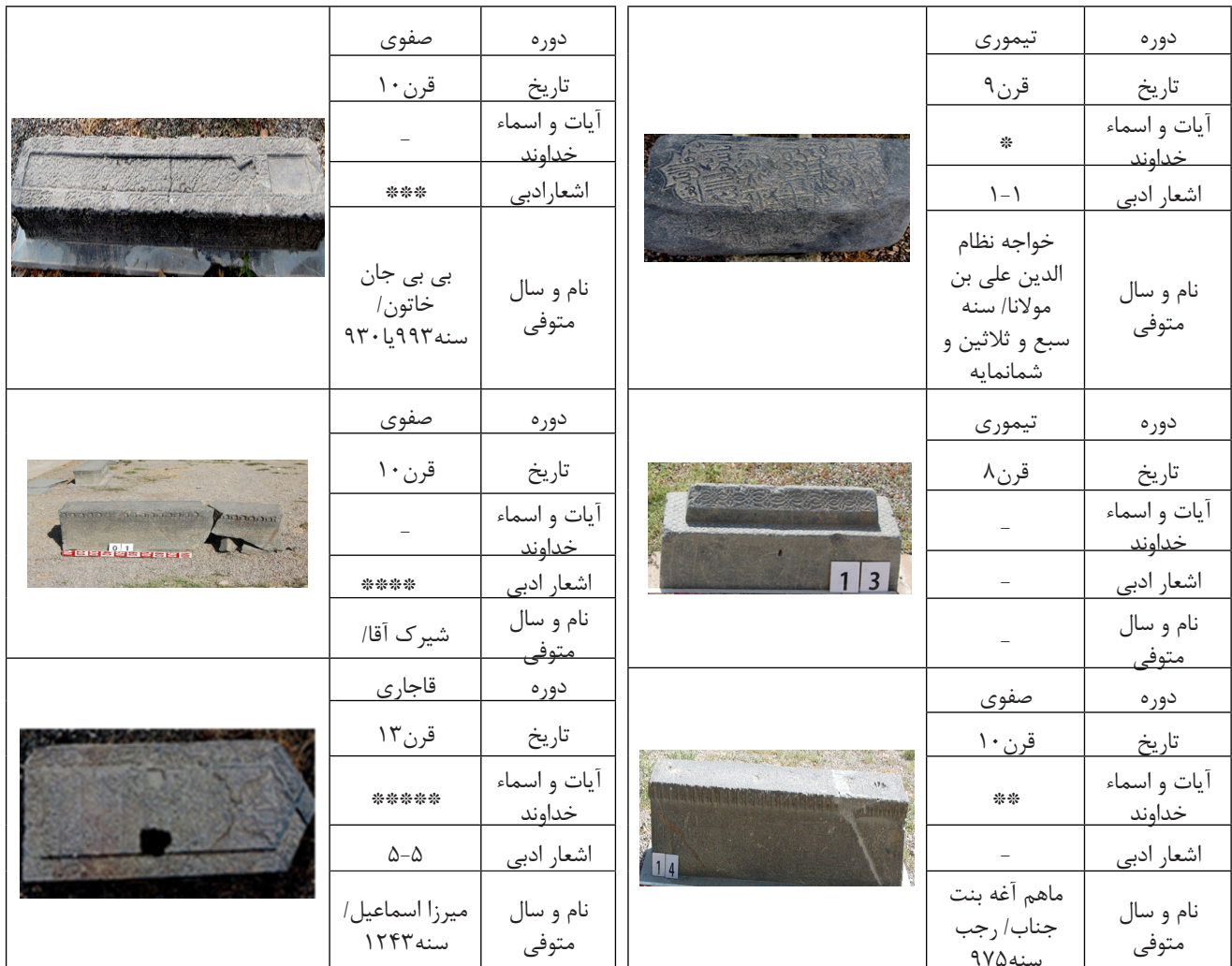
جدول ۱: نمونه هایی از سنگ‌قبرهای آرامگاه توس (نگارندگان، ۱۳۹۶).

شده است سنگ‌قبرهایی که از لحاظ خطوط و نقوش دارای تزیینات بیشتر و کامل‌تری هستند مورد بررسی قرار گیرند و از تکرار سنگ‌هایی که از لحاظ نقش، طرحی شبیه به هم