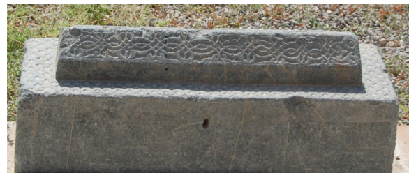
تصویر ۳: شکل صندوقی سنگ قبر دوره تیموری موجود در مجموعه