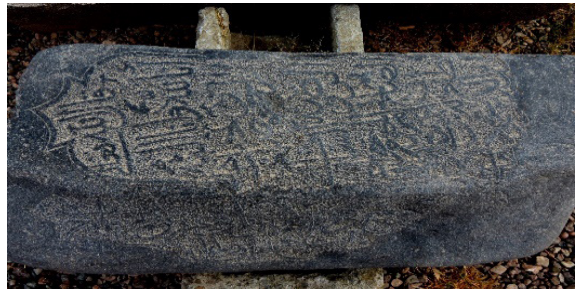
تصویر ۱۰: سنگ قبر دوره تیموری محفوظ در مجموعه هارونیه (نگارندگان، ۱۳۹۶).

نکته آخر محتوای کتیبه‌های نقش‌بسته بر سنگ قبور است. آنچه مسلم است این که بر تمامی سنگ‌قبرها صلوات بر چهارده معصوم عمدتاً بر حاشیه صورت قبر و یا حاشیه زیر قطار بندی مقرنس جانب سنگ‌قبر است و شیعه بودن شخص متوفی را روایت می‌کند. در بازوبندی جانب قبور دعای نادعلی به ثلث و بسیار زیبا تا دوره قاجار و سپس به نستعلیق حکاکی شده است. بر صورت قبر تا اواخر دوره صفوی در این