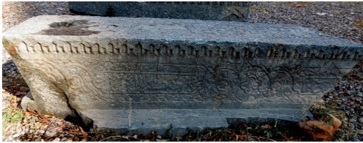
تصویر ۶: سنگ قبر دوره صفوی محفوظ در مجموعه هارونیه.

سر هم شامل نقوش اسلیمی و ختایی (اغلب ختایی) آراسته شده است. ضروری‌ست یادآوری شود که این مستطیل از اواخر عصر صفوی و به‌ویژه در عصر قاجار به ردیف‌های پشت سرهم تقسیم شده که کتیبه‌ای طولانی بر صورت قبر است (تصویر ۶-۷).