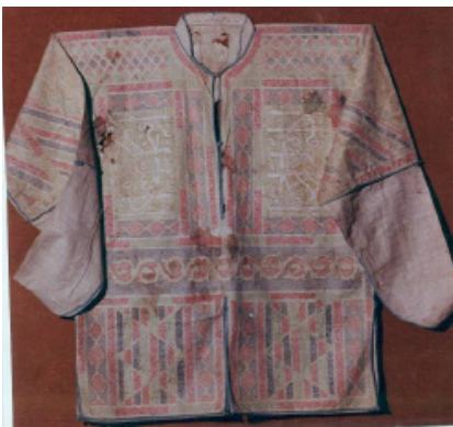
تصویر ۹: پیراهن

جامه فتح با شماره موزه ۸۳۷۵ که به پیراهن نادعلی یا آیه‌الکرسی نیز معروف است و تقریباً تمام سطح آن از آیات قرآن کریم و ادعیه مختلف پوشیده شده، لباسی است عباگونه که در پوشش بالاتنه کاربرد داشته و قسمتی از آستین‌های گشاد آن بدون نوشته‌است. دعای جوشن کبیر که از ۱۰۰ قسمت تشکیل شده‌است و اسماء خداوند را بیان می‌کند، بر روی پیراهن نادعلی مشاهده می‌شود که هر بخش از دعا، درون فضای دایره‌ای شکل نوشته شده‌است. در تحریر آیات و ادعیه روی پیراهن نادعلی از قلم‌های غبار، مشقی و جلی استفاده شده‌است. دومین پیراهن دارای شماره موزه ۸۴۰۳ (تصویر ۹) است. قدمت این پیراهن نخودی‌رنگ که در جلو و پشت، درون اشکال هندسی، دعا و آیاتی از قرآن به خط غبار و ثلث نوشته شده‌است و قسمت پایین دارای نقوش گل و بوته به رنگ‌های قرمز و سبز می‌باشد، به دوره صفوی می‌رسد.