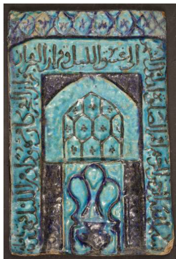
بقره آمده است تصویر ۱۲: طول: ۲۹/۸ س. م.، عرض: ۲۰ س. م. (موزه ملی ایران، شماره موزه ۲۲۴۴۹).

الرحمن الرحيم“ شروع شده و در ادامه آن آیه ۲۵۵ از سوره