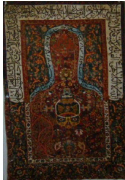
تصویر ۳: قالیچه سجاده‌ای

رحیم، یا کریم، یا قدیر، یا قدیم، یا عظیم، یا علیم، یا حکیم، یا قدوس، یا مالک، یا مقدم، یا مؤخر و یا عزیز». در قسمت بالای محراب و داخل آن که تقریباً سجده گاه نمازگزار است، عبارت «سبحان ربی‌العلی و بحمده» در فضای ترنجی شکلی نوشته شده است.