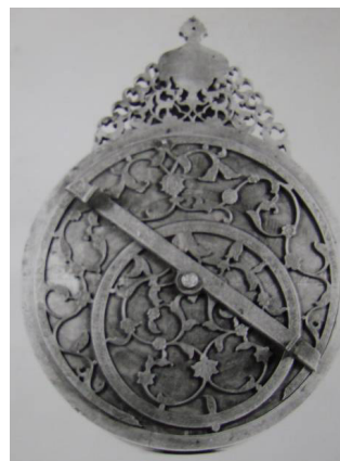
تصویر ۸: اسطرلاب، قرن ۱۲ هـ. ق.

بهترین مصداق آن در میان داده‌های پژوهش، سه پیراهن معروف به جامه فتح یا آیه‌الکرسی است که در نزد عموم به پیراهن (نادعلی) معروف هستند. این جامه‌ها کاملاً جنبه تعویذ داشته و استفاده از آن در دوره صفوی و پس از آن به هنگام گرفتاری و بیماری و یا وقت کارزار در زیر زره، جهت حفاظت در برابر بلا و خطرات رایج بوده‌است (ساریخانی، ۱۳۹۰: ص ۷۳).