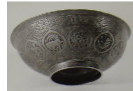
تصویر ۱۰: جام برنجی چهل کلید، خراسان، قرن ۱۱ هـ.ق، ارتفاع: ۲/۴ و قطر دهانه: ۸/۱۲ س. م (موزه ملی ایران، شماره موزه ۲۰۲۶۳).

جام برنجی چهل کلید با شماره موزه ۲۰۲۶۳ به سال ۱۶۳۰ م/۱۰۴۰ هـ.ق. در خراسان ساخته شده است. تمام سطح داخلی و خارجی ظرف مملو از کتیبه‌هایی است به خط نستعلیق و ثلث. روی لبه ظرف که سطح کمی دارد، سوره حمد نوشته شده و در ادامه آن «آیه‌الکرسی» آمده است که به