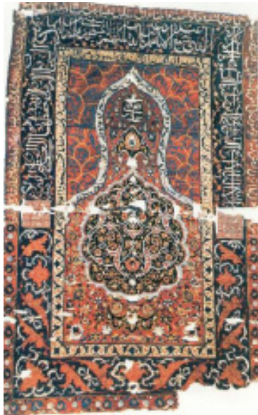
تصویر ۲: قالیچه سجاده‌ای، محل بافت: تبریز، قدمت: اواخر قرن ۱۰ و قرن ۱۱ هـ. ق. طول ۱۶۶ و عرض ۲/۱۰۸ سانتیمتر (موزه ملی ایران، شماره موزه ۳۴۰۶).

متن فرش دارای طرح محرابی است که اطراف این طرح درون حاشیه، آیه‌ای نوشته شده‌است و در قسمت بالای متن اسماء اعظم کتابت شده و در وسط متن ترنجی به رنگ سرمه‌ای نقش شده‌است (گانزروندن، ۱۳۵۷: ص ۶۲ و Pop; Vol. XI pl.1168B). حاشیه خارجی دارای زمینه قرمز است که به خط نستعلیق و به رنگ نخودی آیه ۲۸۵ سوره بقره بافته شده است. حاشیه میانی با زمینه سبز آیه ۲۵۵ بقره به خط ثلث و به رنگ نخودی نوشته شده‌است. حاشیه داخلی دارای زمینه نخودی که به خط نستعلیق و به رنگ سیاه آیات ۷۸ و ۷۹ سوره اسرا روی آن نوشته شده و حاشیه اطراف طرح محرابی به رنگ نخودی است و به خط نستعلیق و به رنگ قهوه‌ای آیات ۴۰ و ۴۱ سوره ابراهیم روی آن نوشته شده‌است. در دو سمت راست و چپ، در وسط حاشیه بزرگ، در متن سرمه‌ای رنگ، در درون دو مربع لاکه رنگ با شیوه گره چینی (کوفی بنایی) چنین نوشته‌اند: «لا اله الا الله محمد رسول الله علی ولی الله». در قسمت بالایی متن لاکه رنگ جانمازی، با خط آبی، کلمات زیر در قسمت‌های تعیین شده چنین آمده‌است: «بالله، یا رحمن، یا