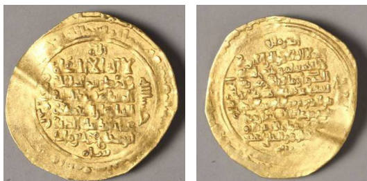
تصویر ۷: سکه زرین غیاث الدین ابو شجاع محمد (۴۹۸-۵۱۰ هـ ق) سلجوقی، وزن: ۱۴/۲، قطر: ۲۲/۶۸، محل ضرب سکه: اصفهان، سال ضرب سکه ۵۱۰ هـ ق