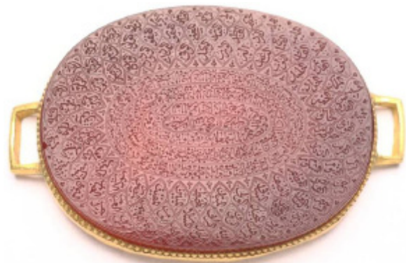
تصویر ۵: مهر از جنس عقیق به شکل بیضی مسطح با قاب طلا و کتیبه به خط نسخ و ثلث: آیاتی از قرآن کریم، آیه الکرسی، و ان یکاد، و نصر من الله و فتح قریب و اسامی خداوند (موزه ملی ایران، شماره موزه ۱۸۷۱).