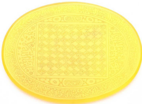
تصویر ۶: مهر از عقیق، دوره قاجار، طول: ۱/۵ س. م. عرض: ۸/۳ س. م. کتیبه: «آیه الکرسی» و «اسامی خداوند» به خط نسخ و ثلث (موزه ملی ایران، شماره موزه ۱۶۱۲).

همراه با خطوط مختلف به کتابت آیه الکرسی پرداخته‌اند می‌توان به آثار با شماره موزه‌های ۱۸۷۱ (تصویر ۵)، ۱۶۱۹ (آیه الکرسی در داخل مربع میانی و اسامی ۱۲ امام (ع) در دایره‌های کناری)، ۱۶۲۳ (کتیبه: شامل آیه الکرسی و اسامی ۱۴ معصوم (ع) به خط ثلث می‌باشد و به دوره صفوی تعلق دارد) و ۱۶۱۲ اشاره کرد (تصویر ۶).