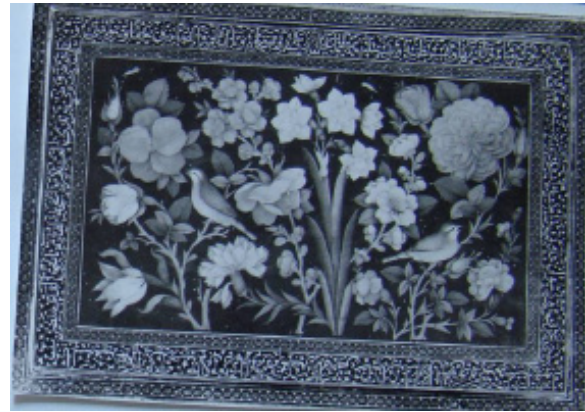
تصویر ۴: قاب آینه لاک، اوایل قاجار، طول ۳۰ و عرض ۲۰.۵ سانتی‌متر (موزه ملی ایران، شماره موزه: ۴۳۸۸).

بن ملک شاه». اطراف متن: «حسبنا الله و نعم الوکیل» (سوره مبارکه آل عمران آیه ۱۷۳)؛ حاشیه داخلی: «بسم الله الرحمن الرحیم ضرب هذا الدینار باصفهان سنه عشره و خمسمائه»؛ و پشت سکه متن: «العزه لله، الله لا اله الا هو الحی القيوم لا تاخذه سنه ولا نوم له ما فی السموات و ما فی الارض من ذالذی یشفع عنده الا باذنه یعلم ما بین ایدیهم و ما خلفهم ولا یحیطون بشئ من علمه الا بما شاء و سع کرسیه السموات و الارض و لایوده حفظهما و هو العلی العظیم» (سوره مبارکه بقره آیه ۲۵۵) (آیه الکرسی) کتابت شده است. این سکه احتمالاً به میمنت ماه مبارک رمضان ضرب گردیده است. اطراف متن: «الحمد لله العظمه لله».