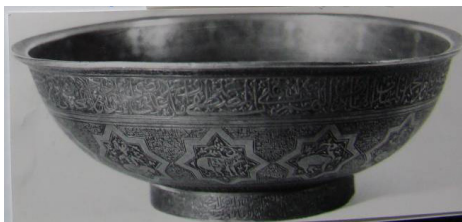
تصویر ۱۱: جام چهل کلید، قرن ۱۱، خط نستعلیق، ثلث و نسخ، (سوره‌های فاتحه، اخلاص، کافرون، فلق، الناس، نصر و آیه‌الکرسی و دعا و صلوات بر ائمه معصومین) (موزه ملی ایران، شماره موزه ۸۵۴۰).

نمونه دیگر از گروه دوم یک صفحه فولادی است که دارای شماره موزه ۲۳۶۹۱ می‌باشد. این صفحه فولادی با طول و عرض ۱۳.۵ سانتی‌متر است و تاریخ آن به قرن ۱۳ هـ.ق، می‌رسد. این اثر یک صفحه مستطیل است که قسمت بالای آن حالتی محرابی شکل دارد و از ۴ برآمدگی کوچک در دو طرف و یک برآمدگی بزرگ در وسط تشکیل شده است. روی صفحه سه سوراخ دیده می‌شود که دو تا در بالا و یکی در وسط صفحه قرار دارد و در یکی از سوراخ‌های بالا میخی پرچ شده است و دارای تزیینات کنده کاری و طلاکوبی است. در روی صفحه