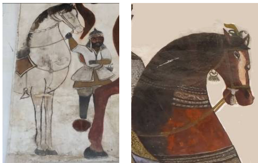
تصویر ۸: نقش اسب در نقاشی بقعه.

کاملی از فرم‌ها و مضامین مذهبی دارد. حرکات قلم‌موی او در ترسیم نقاشی، به‌کار بردن رنگ‌ها در جای خویش و حافظه شنیداری او، همه و همه در جهت پیشرفت آثارش با وی همراهی می‌نمایند. در این میان شاگردانش در انجام کارهای ساده کمک او هستند و در ترسیم قاب‌های ساده و کنار هم نهادن کاشی‌ها و دیگر امور مربوط به تزئینات به نقاش کمک می‌رسانند. در بنای بیرونی بقعه و مشرف به حیاط مرکزی، چهار دیوار وجود دارد، دیوار شرقی نزدیک به در ورودی قبر مطهر آقامیرشمس‌الدین (ع) با نقاشی دیواری تزئین شده‌است. برخی از عناصر به‌کار رفته در این نقاشی، به دلیل ایجاد ساختار متقارن که سابقه‌ای کهن در نقاشی ایرانی دارد، شاخص‌تر می‌باشند که در این بخش، معرفی می‌گردند در دو دیوار میانی و غربی در قسمت پایین کاشی هفت‌رنگ دیده می‌شود که در جدول شماره (۱) نقوش آن بررسی شده‌است. در قسمت بالایی دیوار غربی، خط نوشت‌های به خط نستعلیق است که شعر معتبر محتشم کاشانی و در ثای حضرت امام حسین (ع) می‌باشد.