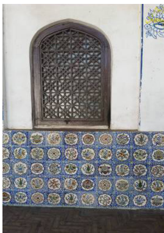
تصویر ۴: طرح کاشیکاری بقعه.

پس از اسلام هنر کاشی کاری یکی از مهم ترین عوامل تزئین و پوشش برای استحکام بناهای گوناگون در نظر گرفته شد. در این بقعه از کاشی کاری هفت رنگ در تزئین بنا استفاده شده است. طرح کاشی ها به صورت قاب قابی می باشد که درون هر قاب با آرایه ای نباتی یا گیاهان هم نشین با پرندگان تزئین شده است. این آرایه ها شامل نقش درخت سرو با پرند، بوته گلی واژگون و گل شش پر می باشند، به جدول ۱ مراجعه شود. از رنگ لاجوردی و قهوه ای بیشتر در کاشی ها استفاده شده است و تمام آرایه های تزئینی کاشی درون قابی سفید ترسیم گردیده اند که با رنگ لاجوردی قلم گیری شده اند که در تصویر ۴ دیده می شود. رنگ هادر این کاشی کاری نمادی از زمین و آسمان محسوب می شوند. روان شناسان معتقدند که رنگ آبی تیره که لاجوردی نیز از طیف همین رنگ است، نمایانگر شب می باشد (Hillenbrand, ۱۹۹۹: ۵۱۰).