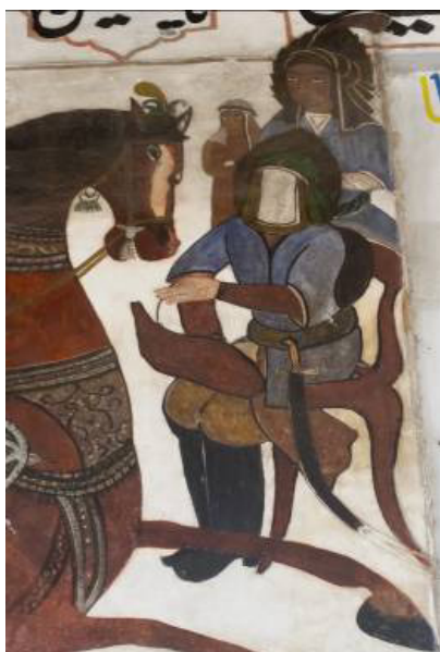
تصویر ۱۰: شمایل مبارک امام حسین (ع) در نقاشی بقعه (مأخذ: نگارندگان).

گل‌ها و گیاهان: نباتات در نقاشی دیواری بقعه تداعی کننده باغ بهشت و ثمره جان‌فشانی‌های شهداست، که به امر خدای مهربان به این مکان توفیق می‌یابند. در نقاشی بقعه میرشمس الدین (ع) چهار نخل در قسمت پایین تصویر دیده می‌شود، به تصویر ۷ رجوع شود که نمایان‌گر نخلستان و محل وقوع جنگ عاشوراست (عمید، ۱۳۳۱: ۵۴۳).