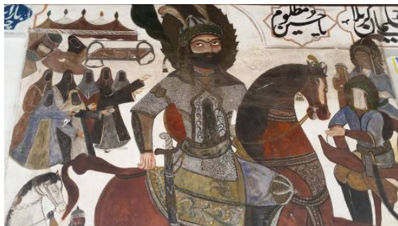
میرشمس‌الدین.