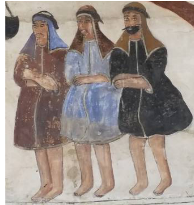
تصویر ۱۱: نقش سه مرد در نقاشی بقعه.

پیکره بانوان: در تصاویر نقاشی بقاع، تصویر بانوان بسیار کمتر از مردان است و اغلب در مجالس فرعی و در اندازه کوچک در حواشی‌اند (میرزایی‌مهر، ۱۳۸۶: ۵۷). در نقاشی این بقعه در گوشه بالایی کادر، زنان ترسیم شده‌اند و نظاره‌گر به میدان رفتن حضرت عباس (ع) می‌باشند. آنان در دست‌ان کاسه ای دارند و گویی از حضرت طلب آب می‌کنند، (تصویر ۱۲). هنرمند نقاش برای این‌که وفاداریش را به فرهنگ دینی خویش نشان دهد، گهواره‌ای را با کودکی خوابیده در آن، در بالای تصویر زنان نقاشی نموده که گهواره حضرت علی اصغر (ع) است. هم‌چنین در این نقاشی پیکر حضرت سجاد (ع) نیز درون خیمه ترسیم شده‌است، (تصویر ۶).