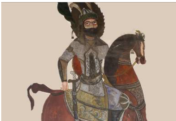
تصویر ۹: حضرت عباس (ع) در نقاشی بقعه.

هاله روی سر امام (ع) به صورت شعله آتش می‌باشد. حضرت نیز لباس رزم برتن دارند و چهره مبارکشان با رنگ طلایی پوشیده شده است. در پایین نقاشی سه مرد دیده می‌شود که لباس رزم نپوشیده‌اند و نظاره‌گر حضرت عباس (ع) می‌باشند، (تصویر ۱۱). به دلیل ذکر نشدن نام این افراد از حدس و گمان استفاده نمی‌نماییم. در سمت چپ نقاشی، تصویر مرد دیگری ترسیم شده که افسار اسبی سفید را در دست دارد و او نیز لباس رزم بر تن دارد.