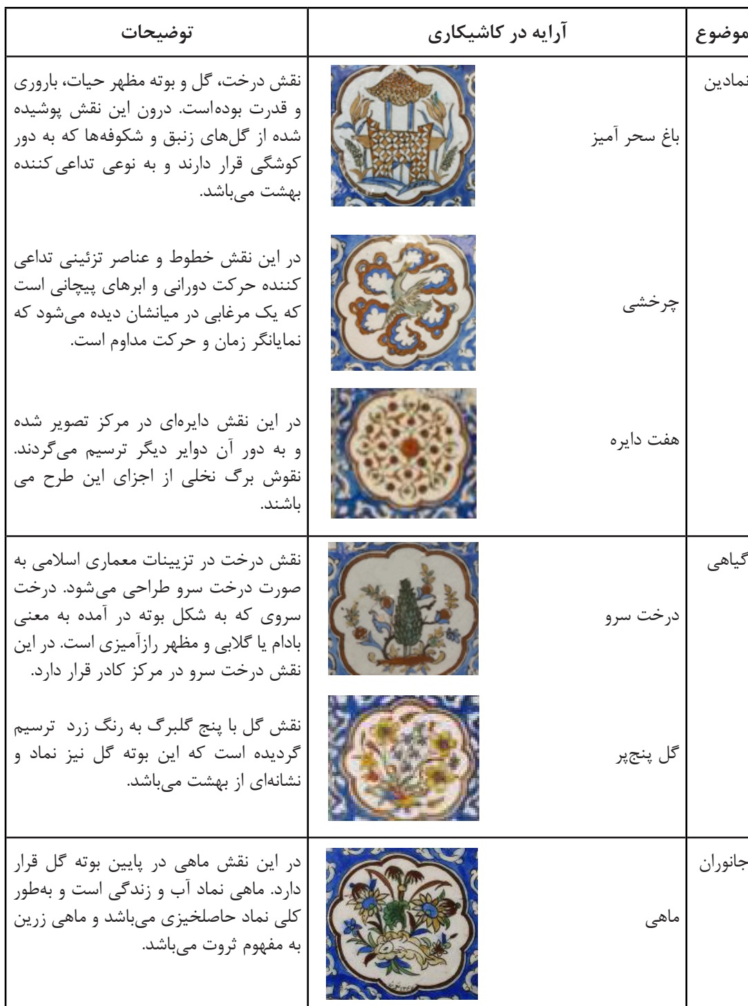
جدول ۱: بررسی نقوش در کاشیکاری بقعه آقامیرشمس‌الدین.