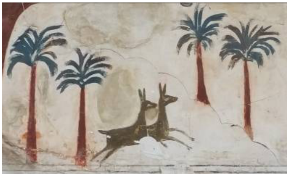
تصویر ۷: نقش آهو و نخل در نقاشی بقعه.

جانوران: در پایین کادر نقاشی بقعه میرشمس الدین (ع)، دو آهو دیده می‌شوند که در میان نخلستان در حال دویدن می‌باشند، (تصویر ۷) آهو نماد معصومیت و وفاداری می‌باشد. اسب نیز شاخص‌ترین حیوان حاضر در صحنه نقاشی بقعه است، (تصویر ۸). ذوالجناح، اسب امام حسین (ع)، اسب حضرت علی اکبر (ع) و اسب حضرت عباس (ع) هر کدام و به‌خصوص ذوالجناح، دارای داستانی حزن‌انگیزند و بدین خاطر یکی از عناصر اصلی در نقاشی‌های بقاع می‌باشند (جعفری، ۱۳۶۴: ۵۶). در نقاشی بقعه میرشمس الدین (ع) اسب حضور موثری دارد و تصویر اسب در دو قسمت دیده می‌شود. اسب حضرت عباس (ع) در حال تحرک و تاخت نشان داده شده‌است و نقش اسب سفید دیگر در گوشه پایین، سمت راست نقش وجود دارد.