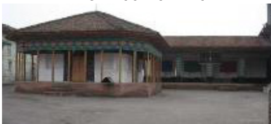
تصویر ۲: نمایی کلی از ضلع شمالی بقعه.

غیر از کتاب‌هایی که درباره مقابر امامزادگان به رشته تحریر درآمده است، در خصوص این بقعه تاکنون مطالعاتی صورت نپذیرفته است.