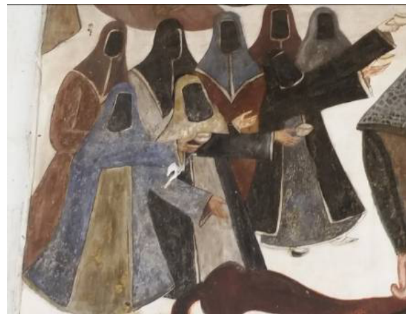
تصویر ۱۲: تصویر زنان در نقاشی بقعه.

پیکره بانوان: در تصاویر نقاشی بقاع، تصویر بانوان بسیار کمتر از مردان است و اغلب در مجالس فرعی و در اندازه کوچک در حواشی‌اند (میرزایی‌مهر، ۱۳۸۶: ۵۷). در نقاشی این بقعه در گوشه بالایی کادر، زنان ترسیم شده‌اند و نظاره‌گر به میدان رفتن حضرت عباس (ع) می‌باشند. آنان در دست‌ان کاسه ای دارند و گویی از حضرت طلب آب می‌کنند، (تصویر ۱۲). هنرمند نقاش برای این‌که وفاداریش را به فرهنگ دینی خویش نشان دهد، گهواره‌ای را با کودکی خوابیده در آن، در بالای تصویر زنان نقاشی نموده که گهواره حضرت علی اصغر (ع) است. هم‌چنین در این نقاشی پیکر حضرت سجاد (ع) نیز درون خیمه ترسیم شده‌است، (تصویر ۶).