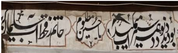
تصویر ۱۳: قسمتی از شعر محتشم که در بالای نقاشی نوشته شده‌است.

هم‌چنین در زیر سقف ایوان بقعه، نقوش شش‌ضلعی به رنگ قهوه‌ای ترسیم گردیده که در درون آنها جمله «یا حسین مظلوم (ع)» به خط نستعلیق نوشته شده‌است. هم‌چنین در کنار نقاشی دیواری، جمله «یا علی (ع)» هم به خط نستعلیق نوشته شده‌است.