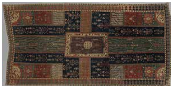
تصویر ۲: قالی چهارباغی، نیمه دوم قرن ۱۸ میلادی، موزه متروپولیتن (Ballard, 2016).

بخش تقسیم می‌شده است و یا مصادیق موجود باغ ایرانی و عدم تطابق آن‌ها با الگوی چهار قسمتی، نیست؛ پیرامون این مناقشات، در مقاله‌ای با ذکر اسنادی، الگوی چهارباغ در پلان باغ پاسارگاد و بقیه مصادیق تاریخی تا نمونه‌های عهد صفوی، این موضوع نقد شده است و ذکر شده: «هیچ مدرک نوشتاری، تصویری و یا معماری به طور دقیق این عقیده را تأیید نمی‌کند که باغ ایرانی فضایی است با تقسیم چهارگانه به همراه حوضی مرکزی و چهار جوی که از آن منشعب می‌شود و اغلب چهارباغ نامیده می‌شود» (حیدر نتاج و منصوری، ۱۳۸۸) اما همان طور که در (عکس ۲) و (عکس) دیده می‌شود، دسته‌ای از قالی‌های باغی یافت می‌شوند که صراحتاً می‌توان آن‌ها را قالی‌های چهارباغی نامید و دسته‌ای دیگر نیز با اندکی تغییرات در ساختار ترکیب بندی، تلویحاً در این زمره قرار می‌گیرند.