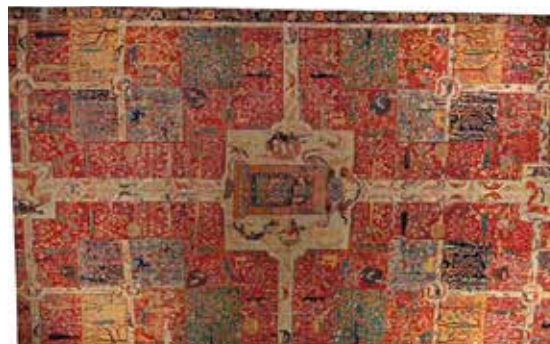
تصویر ۴: بخشی از قالی چهارباغی جیبور، ۱۶۳۲ میلادی

همان‌طور که در جدول آمده است واژه چهار (چار) باغ می‌تواند معانی همچون باغ چهار (چند)گانه، باغ جهان، باغ تام و جاوید، باغ شاه به خود بگیرد. در نمونه‌های تاریخی قالی‌های چهارباغی نیز انواعی یافت می‌شوند که الزاماً تقسیمات آن‌ها چهارگانه نیست اما مضربی از چهار در طراحی فرم آن‌ها دیده می‌شود (عکس ۴).