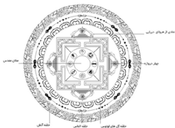
شکل ۱: ساختار تشکیل دهنده نقاشی ماندالا (Shakya, 2016).

مقدسی را تعیین می‌کند و آن را از تهاجم نیروهای تجزیه کننده یا گسلنده بی که به صورت دایره‌های اهریمنی نمادین شده حفظ می‌کند. بیش از همه نقشه عالم است (توچی، ۱۳۸۸: ۳۱). ماندالا که نقش جهان است به انواع و اقسام گوناگون جلوه می‌کند، ممکن است، به صورت تصویری که چندین دایره متحدالمرکز دارد و در میان آن مربعی است که چهار دروازه دارد، ظاهر شود. در مرکز ماندالا تصاویر خدایان یا علائم آن‌ها، تصویر بودا یا تمثیلی که نشان‌دهنده آمیزش عبادی (ازدواج مقدس) شیوا، «اصل نرینگی» - مثلث‌هایی که رو به بالا است - و شاکتی «اصل مادینگی» - مثلث‌هایی که روبه پایین است - قرار می‌گیرد (شایگان، ۱۳۸۰: ۱۹۲). برای تصور بهتر، تصویر یکی از ماندالاها و ساختار آن در (شکل ۱) توضیح داده می‌شود.