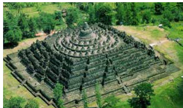
تصویر ۱: معبد بودائی برودور ۷ ، جاوه مرکزی، اندونزی

آن چه که از مقایسه این مفاهیم با دیگر تمدن‌ها مشاهده می‌شود، می‌توان به وجه اشتراک مفهوم ماندالا در همه تمدن‌های آسیایی پی برد از جمله زیگورت های بین النهرین، پلان شهر شاهی پادشاهان ایرانی، نقش آرمانی کاخ شاه جهان سنت هندی، در آداب عزایم خوانی بومی تبتی همگی گونه‌ای از بازنمایی ماندالا هستند (توچی، ۱۳۸۸: ۳۲-۳۱). در (عکس ۱) معبد بودائی مشاهده می‌شود که دایره‌ها و مربع‌های متحدالمرکز ماندالا در آن به خوبی نمایان است و از این دست، نمونه فراوان در تمدن‌های دیگر یافت می‌شود.