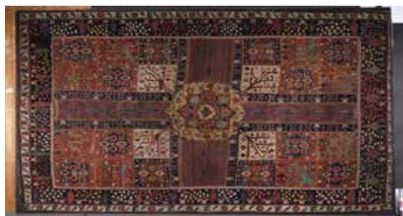
تصویر ۳: قالی چهارباغی، ۱۷۰۰-۱۸۰۰ میلادی، بافت ایران، موزه ویکتوریا آلبرت لندن (V&A's collections, 2016).

به همین منظور در این بخش به واژه‌شناسی باغ و مفهوم آن در فرهنگ ایرانی پرداخته می‌شود تا بتوان مقایسه لازم